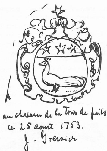
Fig. 4. Cachet de 1753 relevé par D. L. Galbreath.

cachet de 1753: d'argent au paon passant, au chef d'azur chargé de trois étoiles. Et pour cimier, une fleur de lys. Mais la figure qui accompagne cette notice montre un paon rouant. Le cachet mentionné est resté introuvable 8 , mais nous en possédons un croquis de la main de l'auteur (fig. 4) 2 , qui montre bien le paon passant; le cimier en est une étoile et non une fleur de lys.