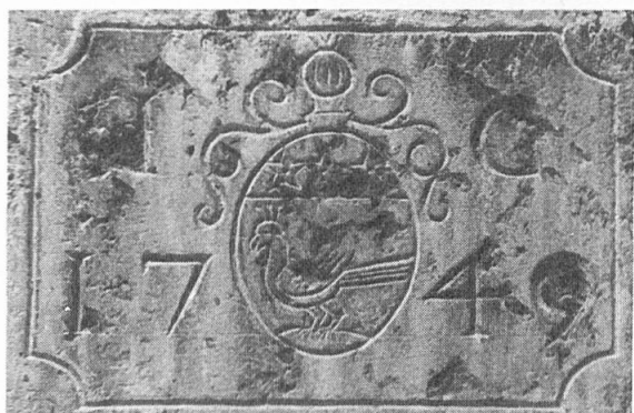
Fig. 1. Pierre sculptée, 1749.

L'ancienne forteresse savoyarde tombait alors en ruine, seule une tour était encore habitable (comme prison de la châtellesnie). Gressier fit réparer les deux tours, rasa les restes du donjon et établit une terrasse sur laquelle il construisit le bâtiment d'habitation qu'on y voit encore. Il est l'auteur du projet de construction du nouveau port de La Tour-de-Peilz 3 . « Agé d'environ 81 ans », il mourait le 4 juin 1785 4 , ne laissant qu'une fille, Anne Catherine, qui avait épousé en 1764 4 Jean Rodolphe Frédéric de Blonay (1732-1818), qualifié ultérieurement de seigneur de La Tour-de-Peilz. Le château fut revendu en 1789 à Paul Martin, de Genève 5 .