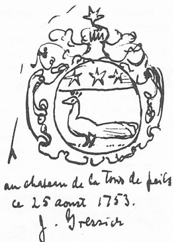
Fig. 4. Cachet de 1753 relevé par D. L. Galbreath.

cachet de 1753: d'argent au paon passant, au chef d'azur chargé de trois étoiles. Et pour cimier, une fleur de lys. Mais la figure qui accompagne cette notice montre un paon rouant. Le cachet mentionné est resté introuvable 8 , mais nous en possédons un croquis de la main de l'auteur (fig. 4) 2 , qui montre bien le paon passant; le cimier en est une étoile et non une fleur de lys.