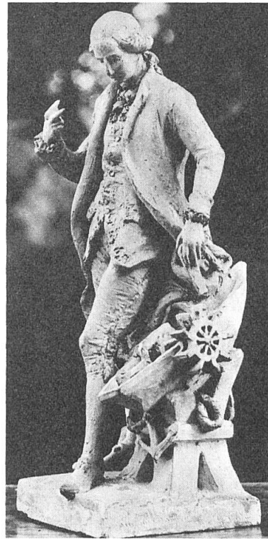
Fig. 3. Maquette de la statue de C.F.D. de Jouffroy d'Abbans, l'inventeur de la navigation à vapeur, élevée à Besançon, place de la Madeleine, détruite par les Allemands en 1943.