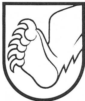
Fig. 1. Büren et Nidau.

Le premier sceau officiel de Berne, datant de 1224, montre un ours posé en bande. Ce blason parlant au plantigrade populaire et redouté a été porté dès lors par la République et la Ville de Berne ( de gueules à la bande d'or chargée d'un ours de sable langué, armé et vilené de gueules ). La patte droite de l'ours a été concédée à trois bailliages après leur conquête par les troupes bernoises ou leur occupation: Büren en 1388, Nidau en 1393 et Erlach en 1476. Armoiries de Büren: de gueules à la patte d'ours d'argent mouvant du flanc senestre (Fig. 1); de Nidau: d'argent à la patte d'ours de gueules mouvant du flanc senestre (Fig. 1); d'Erlach (Cerlier): de gueules à la patte d'ours de sable mouvant du flanc senestre tenant un aune (en allemand: Erle) de sinople au tronc d'or (Fig. 2). Ces bailliages sont aujourd'hui districts du même nom.