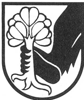
Fig. 2. Erlach (Cerlier).