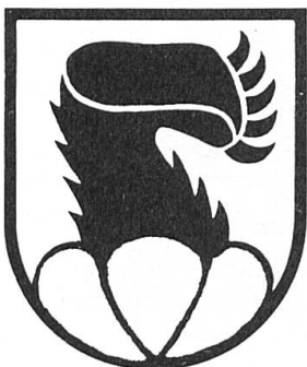
Fig. 4. Reichenbach (vallée de la Kander).