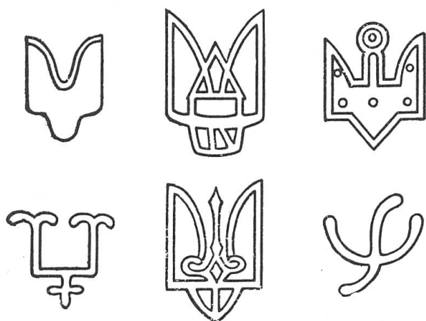
Fig. 1. Quelques «armoiries» rurikides.

Totalement différente de l'héraldique de l'Occident médiéval apparaît dans la Russie du X e siècle une emblématique princière, généralement dénommée rurikide , constituée de signes plus ou moins complexes (fig. 1).