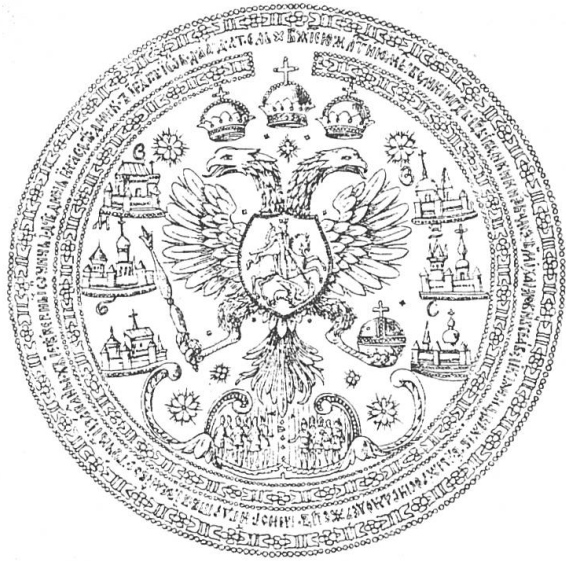
Fig. 5. Sceau d'Alexis Mikhaïlovitch (c. 1620).