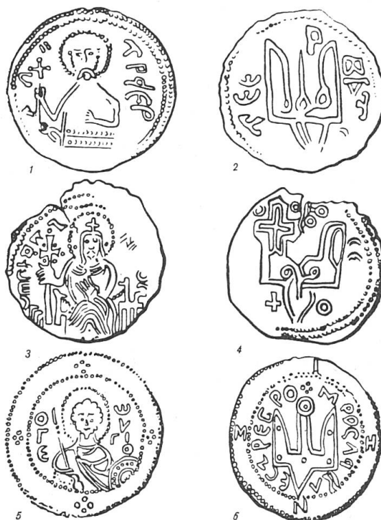
Fig. 2. Monnaies princières armoriées: 1-2: Vladimir Sviatoslav (c. 970), 3-4: Sviatopolk (c. 1000), 5-6: Iaroslav le Sage (c. 1030).

Il est prouvé que ces «armoiries» sont personnelles et qu'en passant du père au fils elles sont brisées soit par addition soit par simplification. La notion d'armes pleines est inconnue: la brisure demeure après la mort du père, la confusion entre deux générations ne doit pas être possible.