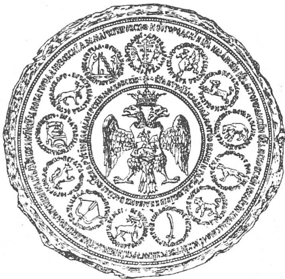
Fig. 4. Sceau d'Ivan IV le Terrible (1533-1584).