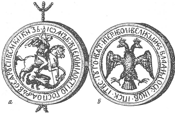
Fig. 3. Sceau d'Ivan III (1462-1505).