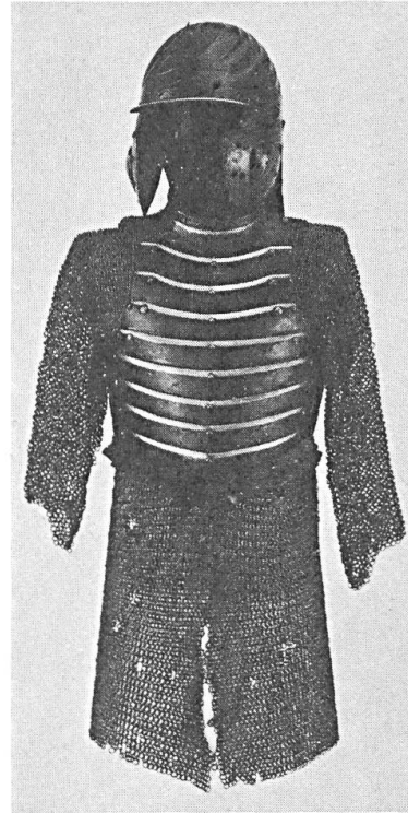
Abb. 3. Offener Helm, kleiner Brustpanzer und Kettenkleid. (Nationalmuseum Budapest.)

Aus diesen Kämpfen entwickelte sich in der zweiten Hälfte des 16. Jh. an den Höfen der benachbarten Länder, so in Prag, Dresden und in Tirol, wo besonders Erzherzog Ferdinand II. daran sehr interessiert war, das sogenannte «Husarenturnier». Ferdinand unternahm im Jahre 1556 einen siegreichen Feldzug gegen die Türken und war auch ein grosser Kenner und Sammler von Waffen und Rüstungen. Besonders schön und wertvoll ist seine «husarische Rüstung», welche schon im Ambraser Inventar von 1583 erwähnt ist und heute in der Waffensammlung des Kunsthistorischen Museums in Wien zu bewundern ist. Diese Rüstung wurde um 1556 bis 1557, wahrscheinlich in Augsburg angefertigt. Ihre Bestandteile sind folgende 3 :