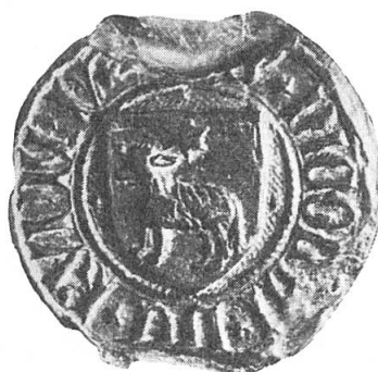
Abb. 2. Siegel des Klaus von Rüdli II., Landammann zwischen 1431–1453. Original im Staatsarchiv Obwalden, ø 30 mm.

Landammann und durch sein vorerwähntes Testament um Kägiswil sehr verdient. Sein Wappen (Abb. 2) 7 enthält dieselben Attribute, doch ist das Lamm schreitend dargestellt und in der Mitte vom Stern überhöht 8 .