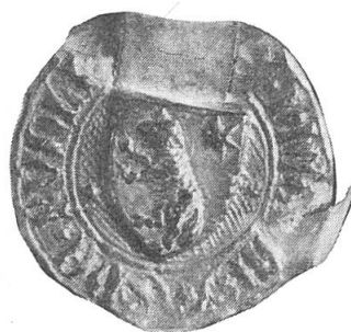
Abb. 1. Siegel des Klaus von Rüdli I., Landammann zwischen 1398–1417. Original im Staatsarchiv Obwalden, ø 30 mm.

Bei dieser Suche nach geschichtlich begründeten Motiven stiess man auf das Siegel des Klaus von Rüdli I., der von 1398–1417 mehrmals als regierender Landammann bezeugt ist (Abb. 1) 6 . Er entstammte einem reich begüterten Optimatengeschlecht, dessen Stammsitz das Rüdli zu Sarnen ist. Das Wappenbild zeigt bei unbekanntem Farben ein steigendes Lamm mit einem sechsstrahligen Stern in der heraldisch linken Oberecke. Der Sohn Klaus von Rüdli II. war zwischen 1431 und 1453 ebenfalls mehrfach