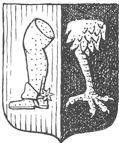
Fig. 3. Henrion-Staal de Magnoncour.

de gueules au houeau d'or, armé et éperonné de même (Henrion de Magnoncour); au 2 de sable à une patte de griffon d'or (de Staal). (Fig. 3.)