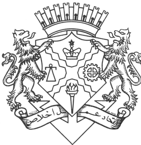
Fig. 1. Les grandes armes de Casablanca.

Le tout est posé sur une ancre d'azur (fig. 1).