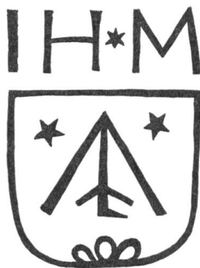
Fig. 4 et 5. Jean-Jacques Junier et Jean-Henry Mentha, XVIII e siècle.

dernière, enfin, aux Archives de l'Etat à Neuchâtel, appartient à la famille Mentha de Cortailod (fig. 5). Une marque combinant un chevron alaisé avec une pièce indéterminée (davier de tonnelier ?) placée en pal est accompagnée en chef de deux étoiles et en pointe d'un mont de trois coupeaux ; elle rappelle un peu celle, formée d'un pal chargé de deux chevrons alaisés, qui est sculptée sur un coffret Mentha-Purry de 1609 ( Armorial neuchâtelois , vol. II, fig. 324).