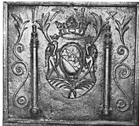
Fig. 9. Indéterminé, 1714.

Entre deux colonnes, un écu ovale portant : de... à la bande de... chargée de trois