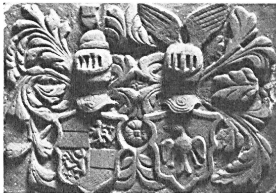
Fig. 1. Pierre aux armes de Wiltz et de Rye (photo René Weydert selon le «Luxemburger Wort»).

Le baron Jean V de Wiltz fut créé comte en 1629 et devint gouverneur de Limbourg en 1640. Le 9.IV.1633 il adressa au roi d'Espagne une supplique demandant à être admis dans l'Ordre de la Toison d'Or en raison des services rendus à la Couronne par la maison de Wiltz. Les deux mariages de Jean V de Wiltz sont restés sans postérité.