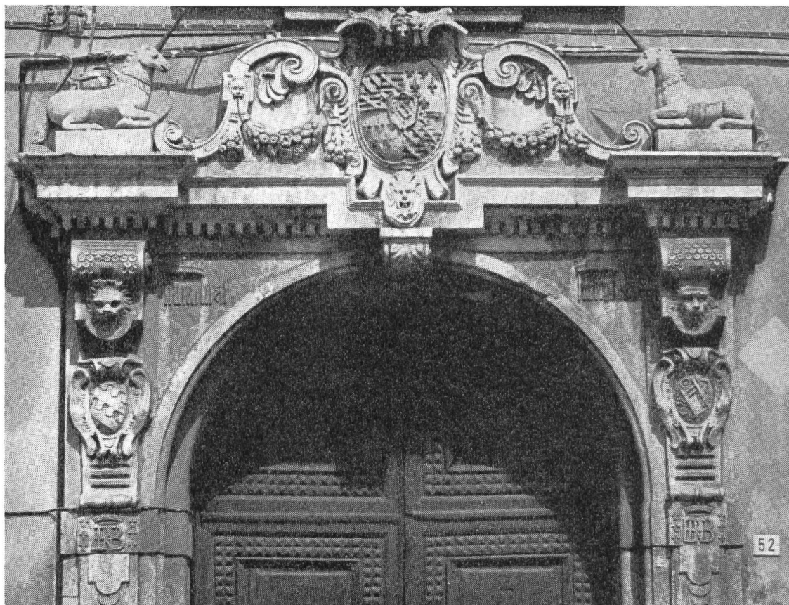
Fig. 1. Portail aux armes Borromée, Arona.

Un écartelé peu commun. — En indiquant dans cette revue 1) les vraies conditions dans lesquelles les armes des Médicis florentins furent adoptées par leurs homonymes milanais 2) , nous avons illustré notre article par les armoiries du cardinal Charles Borromée (1538-1584) qui les portait écartelées avec celles de son oncle devenu le pape Pie IV et dont on trouve natu-