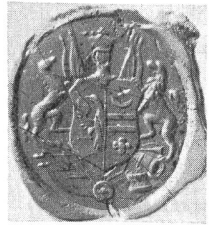
Fig. 1. Cachet de S.S. Wesselowski.

Il s'agit de l'empreinte d'un cachet ovale (dont la matrice devait être en cuivre ou en bronze), mesurant 37 sur 31 mm, la gravure datant de 1820/1831 environ. Tous les ornements extérieurs de l'écu rappelant les armes, grades, actions d'éclat et décorations de Stéphane Sémionovitch Wesselowski, ne laissent subsister aucun doute quant à l'attribution du cachet, en tenant compte de ceci.