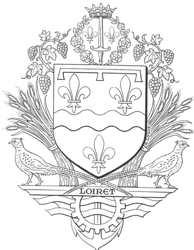
Fig. 1. Armes du Département du Loiret.

Ornements extérieurs: L'écu est sommé d'un chapel de roses tigées et feuillées d'argent (Roseraies du Val de Loire). Elles enferment et sont sommées des armes accordées le 10 décembre 1429 par Charles VII à Jeanne d'Arc, « à sa famille et à toute postérité née et à naître d'elle et d'eux », qui sont: d'azur à l'épée haute d'argent croisée et pommetée d'or soutenant une couronne royale ouverte d'or et accostée de deux fleurs de lis du même. Le dit chapel est accosté de deux pampres d'or fruités chacun de trois pièces de gueules mouvant des flancs du chef de l'écu et ployés vers le chapel (Vins de Loire). L'écu est soutenu par deux gerbes de blé d'or ployées et liées d'argent aux flancs de la pointe de l'écu (Agriculture) et posées sur un entablement du même, sur lequel sont aussi posées, sous les gerbes, deux faisans adossés d'or, leurs queues croisées en sautoir sous l'écu (Chasse). L'entablement chargé de l'indicatif Loiret en lettres onciales de sable broche sur la partie supérieure d'une roue dentée de gueules (Industries), qui broche elle-même sur une fasce ondulée d'azur chargée de deux burelles ondulées d'argent (Loire et affluents, pêche) posée sur la stangue d'une ancre d'or en pal (Batellerie et canal de Briare) (fig. 1).