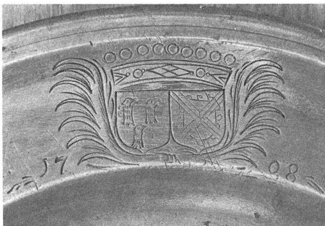
Fig. 1. Armes Colin de Valoreille-Schauenbourg.

Les deux blasons sont surmontés d'une couronne de comte, titre que les COLIN DE VALOREILLE, bien que simples gentilshommes, ont pris à diverses reprises (fig. 1).