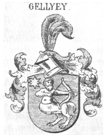
Fig. 6. Centaure sagittaire.

Pour les scènes de chasse, les blasons les plus complets sont ceux où le chasseur et le gibier abattu apparaissent complémentaires, en écusson et cimier. Il se peut que le blason se réduise à l'un ou l'autre de ces deux motifs. Le chasseur à l'affût apparaît également: il porte ses flèches en carquois. D'autres la tiennent encochée, sur arc ou arbalète. Le gibier le plus fréquent est le cerf, le loup, l'ours, puis le bouquetin