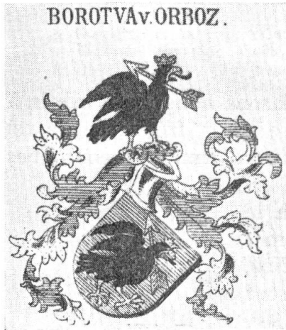
Fig. 3. Flèche transperçant un animal.

Cette dernière attitude nous conduit aux blasons dont la figure principale porte une flèche: chasseur ou guerrier (fig. 2), mais aussi lion ou griffon, plus rarement d'autres animaux: loup, ours ou cerf. S'il s'agit d'un oiseau, la flèche peut