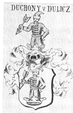
Fig. 2. Flèche portée.

La présente étude est consacrée à la flèche , en tant que motif héraldique. Avant de passer à un examen analytique, rappelons le caractère naturalisant de l'héraldique hongroise. D'origine totémique, enrichie par des motifs