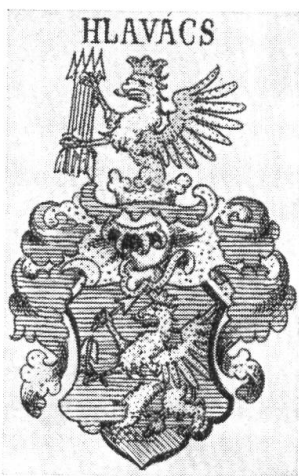
Fig. 1. Flèche brisée.

Il n'est pas nécessaire d'examiner la totalité des blasons hongrois, évalués à quelque 100 000 emblèmes, pour déterminer le caractère ou la fréquence de tel motif héraldique. Il suffit de dépouiller les reproductions d'armoiries contenues dans les six tomes du nouveau Siebmacher consacrés à la Hongrie et à la Transylvanie, ainsi que les trois tomes des Monumenta Hungariae Heraldica , en sus des illustrations qui apparaissent dans les recueils descriptifs d' Áldássy et de Sándor 1) . Ces quelques titres représentent 15 000 blasons environ, nombre suffisant pour tirer les conclusions envisagées et valables pour l'ensemble.