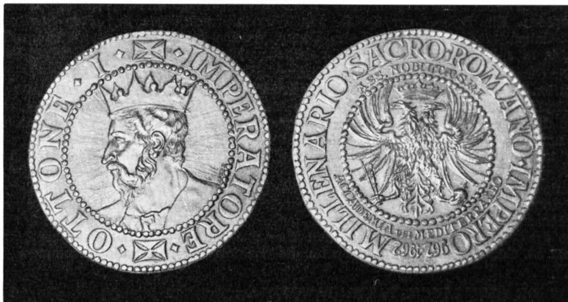
Fig. 1. Medaglia commemorativa del Congresso.