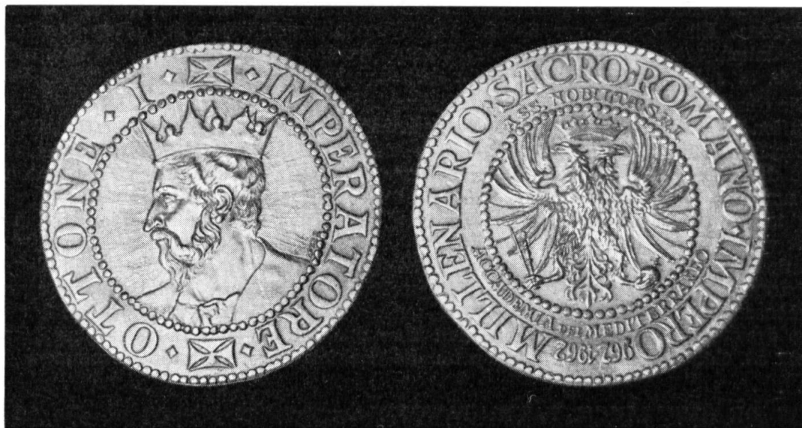
Fig. 1. Medaglia commemorativa del Congresso.

Primo fra questi va menzionato il Prof. Pietro Conte dello Studium Dantis , il quale, con il tema « Dante e l'Impero » ci ha presentato, esposti con vivacità, fatti di cronaca in un quadro di vita del tempo.