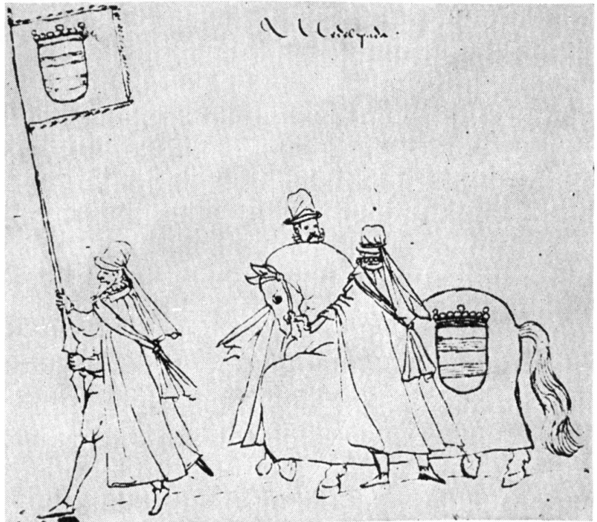
Abb. 1. Wappen der Provinz Medelpad, beim Begräbniszug des Königs Johan III von Schweden, 1592.

SCHWEDEN. — Heraldische Ausstellung in Sundsvall. — Am 24. Mai 1962 wurde im Museum der Stadt Sundsvall eine heraldische und sigillographische Sonderausstellung « Alte Embleme und neue Wappen » eröffnet. Die Ausstellung, die bis Anfangs September dauerte, umfasste ausschliesslich Material, das die emblematische Entwicklung in der die Stadt Sundsvall umgebenden Provinz Medelpad beleuchtet, von den alten Siegeln der Provinz und der Pfarr- und Gerichtsbezirke des 16. und 17. Jahrhunderts bis zu den heutigen, in den letzten Jahrzehnten festgestellten Wappen der verschiedenen Gemeinden. Das Material stellten die entsprechenden Gemeinden und Pfarrämter sowie das Staatsarchiv zur Stockholm und die kgl. Rüstkammer zur Verfügung. Abb. 1.