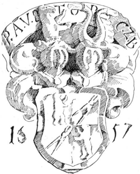
Fig. 1. Hochrelief mit Wappen von Berndorff.

Dieser, 39,5:31 cm messende, in Hochrelief gearbeitete Wappenstein vom Jahre 1657 trägt über dem Vollwappen der ausgestorbenen, bayrischen Adelsfamilie von Berndorff auf einem Schriftband über dem Schild die Buchstaben: P.A.V.B. T.O.R.C.Z.B.: Philipp Albrecht von Berndorff, Teutsch-Ordens Ritter, Comtur zu Beuggen (Fig. 1).