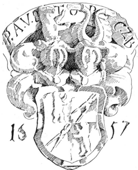
Fig. 1. Hochrelief mit Wappen von Berndorff.

Dieser, 39,5:31 cm messende, in Hochrelief gearbeitete Wappenstein vom Jahre 1657 trägt über dem Vollwappen der ausgestorbenen, bayrischen Adelsfamilie von Berndorff auf einem Schriftband über dem Schild die Buchstaben: P.A.V.B. T.O.R.C.Z.B.: Philipp Albrecht von Berndorff, Teutsch-Ordens Ritter, Comtur zu Beuggen (Fig. 1).