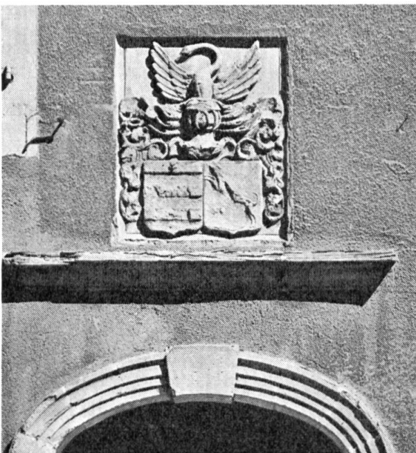
Fig. 2. Portal der «Tour de Mézières» in Coppet mit Allianzwappen Quisard-Chasseur.

Dem aufmerksamen Spaziergänger unter den Arkaden des Städtchens Coppet entgeht eine Sandsteinskulptur wohl kaum, die über dem Portal eines grossen Hauses der Seeseite angebracht ist (fig. 2). Sie stellt ein Allianzwappen dar, das leider den Weg aller Arbeiten in diesem anfälligen Material geht und langsam bis zur Unkenntlichkeit abbröckelt. Es ist deshalb wohl angezeigt, sich näher mit diesem heraldischen Monument zu befassen und es in Wort und Bild festzuhalten.