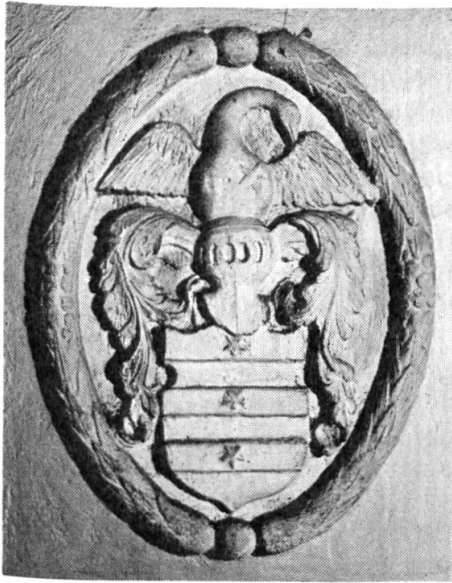
Fig. 3. Wappen Quisard.

515 von Sigismund von Burgund dem Kloster Agaunum (St. Maurice) geschenkt wurde, im 11. Jahrhundert den Grafen von Genf verpfändet war, 1257 an das Haus Savoyen kam und bis ins 16. Jahrhundert nacheinander die Thoyse, Allamandi, Grandson, la Baume, Saluces, Montmayeur, Pollogny, Viry und schliesslich Bern als Herren wechselten sah.