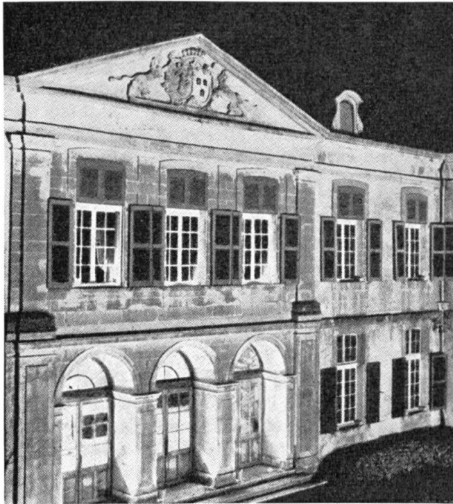
Fig. 5. Allianzwappen Smeth-Kunkler von Schloss Coppet.

Um diese Zeit (1665) erlebte Quisard auch die Umgestaltung der angeblich 1257 von Pierre von Savoyen erbauten Burg Coppet durch den Grafen Dohna. Die Mauern und 3 Türme wurden abgerissen, die Gräben zugeschüttet und gegen Süden ein Ehrenhof angelegt. So wurde