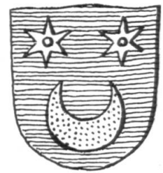
Fig. 6. Wappen Collioud.

Das Allianzwappen über dem Portal ist leider nicht mehr zu retten; die Wappenbilder bröckeln ab und wären nur durch eine Kopie zu ersetzen. Die hübschen Skulpturen der Galerie waren lange Zeit mit graublauer Ölfarbe übermalt. Diese an und für sich hässliche Behandlung hat die Wappen jedoch vor der Verwitterung gerettet. Sie konnten gereinigt und mit einem neuen Anstrich, der Tingierung der Wappen entsprechend, versehen werden. So werden sie der Nachwelt erhalten bleiben und von einer glanzvollen Epoche des schönen Lehensschlosschens in Coppet zeugen.