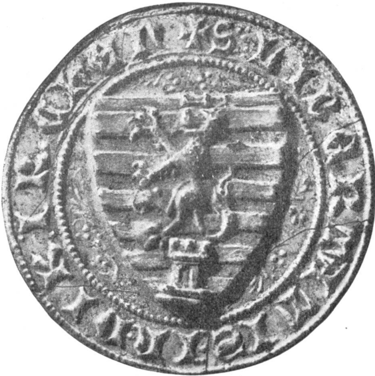
Fig. 7. Sceau de la Ville de Diekirch.

Il s'agit de la matrice en cuivre, de forme ronde, 46 mm de diamètre, propriété de la ville de Diekirch. On situe son origine dans le III e quart du XIV e siècle. L'écu, aux armes de la ville, est ici burelé de 12 pièces, au lion rampant armé, couronné et accompagné d'une tour ajourée à trois créneaux mouvante de la pointe de l'écu. Légende (capitales gothiques) : + S. LIBERTATIS - IN - DIKIRCHEN +. On remarque que le nombre des burelles est différent de celui des armes que nous connaissons habituellement. Notre éminent compatriote M. Jules Vannérus avait, en son temps, préconisé d'adopter pour Diekirch d'or à six fasces d'azur , alors que notre président a toujours conseillé le burelé d'or et d'azur (de 10 pièces) , au lion rampant d'argent, armé, lampassé de gueules et couronné de même, accompagné d'une tour à trois créneaux de gueules, ajourée et maçonnée de sable et mouvante de la pointe de l'écu. On s'est finalement rallié à ce choix. Diekirch ayant été,