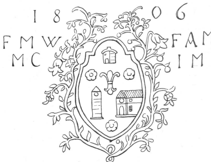
Fig. 16. Armoiries Vuignier. 1806.