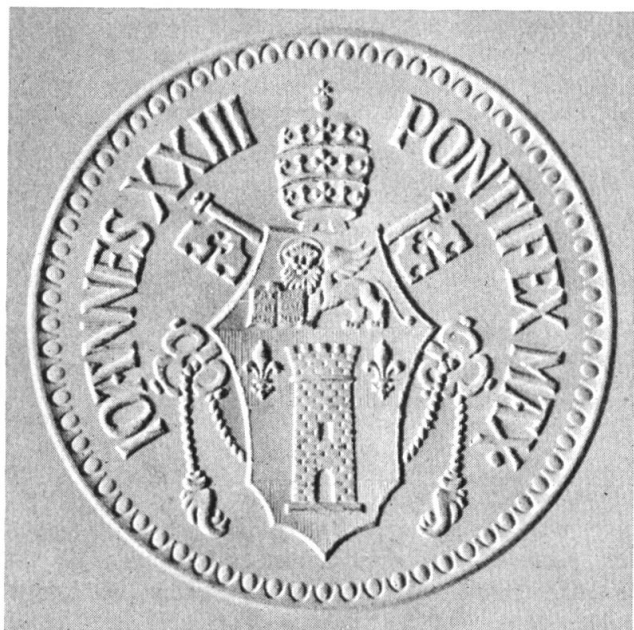
Abb. 6. Prägiesiegel S. H. des Papstes Johannes XXIII.

Als Patriarch von Venedig hat der heutige Papst seinem früheren Wappen das Bistums- oder Patriarchalwappen von Venedig als Schildhaupt hinzugefügt. Dies ist: in Silber der naturfarbene (gelbliche) geflügelte Markuslöwe, der vor sich ein offenes Buch hält mit der Inschrift: PAX TIBI MARCE EVANGELISTA MEUS. Dies geschah so, dass der Turm, der vorher in den oberen