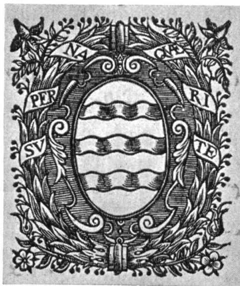
Fig. 19. Armes de la ville d'Yverdon, 1628.

Il est intéressant d'autre part de signaler que les comptes Délard sont établis sur papier filigrané, portant deux écus, sans indication d'émaux, surmontés de deux ours affrontés. L'écu de dextre est un coupé dont le 2 est échiqueté de 6 tires sur 7 divisions verticales. Celui de senestre porte une bande chargée d'une croix dans un carré, accompagnée de deux autres carrés échiquetés de 6 points. Ad. Decollogny.