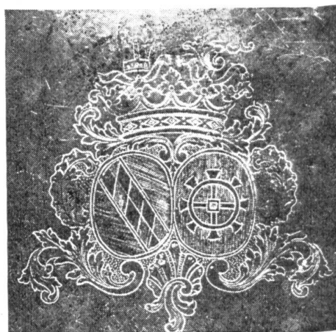
Fig. 14. Armes d'Augustin Muller, abbé de Saint-Urbain.

Mitre et crosse sont les attributs d'un évêque ou d'un abbé, la bande losangée des deux tires du premier écu indique Cîteaux. Le propriétaire