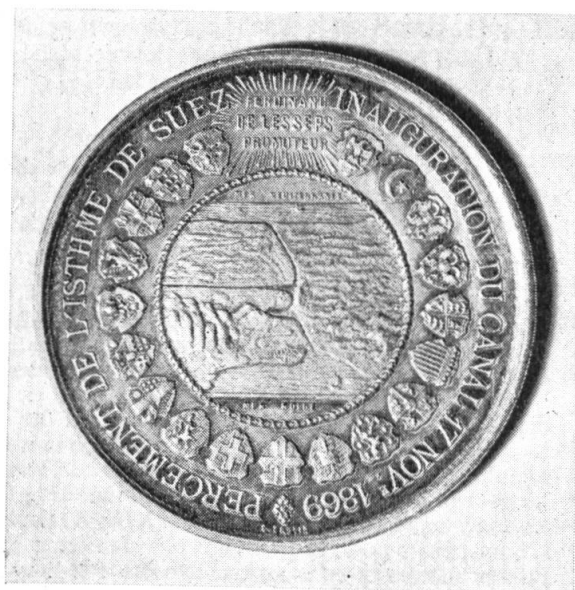
Fig. 11. Médaille inaugurale du Canal de Suez, 1869.

EMPIRE RUSSE: D'argent à l'aigle bicéphale de sable, couronné d'or, becquée, lampassée et armée de gueules, tenant dans ses serres un sceptre d'or à dextre et un