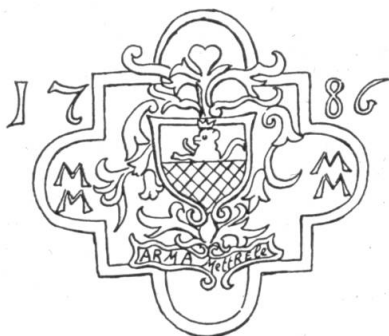
Fig. 15. Armoiries Metrailler. 1786.

Armoiries paysannes valaisannes d'inspiration italienne (voir Archivum Heraldicum 1956, n° 4). — Ces trois nouvelles armoiries ont été relevées dans la commune d'Evolène; deux sont des peintures murales, la troisième est taillée au trait dans le bois d'une poutre. L'origine italienne de ces blasons est indiscutable, elle est particulièrement marquée dans les armes Vuignier portant un baptistère, un campanile et une église, composition architecturale inconnue en Valais.