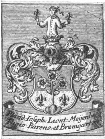
Abb. 15. Ex-libris Meyenberg I.

Die Meienberg oder Meyenberg sind in der Innerschweiz sehr verbreitet. Das Geschlecht stammt aus Hinterburg in der zugerischen Gemeinde Neuheim, wo es schon im 14. Jahrhundert nachweisbar ist. Es verzweigte sich bald auch nach Baar, Menzingen und Zug, ja über die Kantonsgrenzen hinaus nach Bremgarten, Sursee und Luzern. Der Schild ist sprechend. Seine wesentlichen Elemente sind die «Maien» (Blumen) und der Dreiberg. Liess der Letztere in der Entwicklung wenig Veränderungen zu, so boten die Maien Anlass zu Varianten wie Maiglöcklein (Maienrisli) und Rosen. Es bemühten sich die Meienberg in den verschiedenen Gemeinden sich durch Beizeichen wie Sterne, Lilien, Kreuze, aber auch durch verschiedene Farben und Kleinode zu unterscheiden. So führen die von Neuheim und Menzingen in Blau über dem grünen Dreiberg ein goldenes Dreieck, das eine goldene Lilie umschliesst. Aus dem Dreiberg wachsen zwei silberne Maiglöcklein überhöht von einem silbernen Kreuzlein zwischen zwei sechstrahligen goldenen Sternen. Das Wappen der Meienberg von Baar und Zug zeigt in Rot aus grünem Dreiberg wachsend drei silberne, goldbesamte Rosen an grünen, beblätterten Stielen, rechts beseitet von einem sechstrahligen goldenen Stern, links von einer goldenen Lilie. Dazu gesellen sich einige kleinere Varianten, die zum Teil auf Unkenntnis des Trägers oder auf Unverstand des Zeichners zurückzuführen sind 2) .