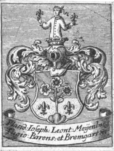
Abb. 15. Ex-libris Meyenberg I.

Die Meienberg oder Meyenberg sind in der Innerschweiz sehr verbreitet. Das Geschlecht stammt aus Hinterburg in der zugerischen Gemeinde Neuheim, wo es schon im 14. Jahrhundert nachweisbar ist. Es verzweigte sich bald auch nach Baar, Menzingen und Zug, ja über die Kantonsgrenzen hinaus nach Bremgarten, Sursee und Luzern. Der Schild ist sprechend. Seine wesentlichen Elemente sind die «Maïen» (Blumen) und der Dreiberg. Liess der Letztere in der Entwicklung wenig Veränderungen zu, so boten die Maïen Anlass zu Varianten wie Maiglöcklein (Maïenrisli) und Rosen. Es bemühten sich die Meienberg in den verschiedenen Gemeinden sich durch Beizeichen wie Sterne, Lilien, Kreuze, aber auch durch verschiedene Farben und Kleinode zu unterscheiden. So führen die von Neuheim und Menzingen in Blau über dem grünen Dreiberg ein goldenes Dreieck, das eine goldene Lilie umschliesst. Aus dem Dreiberg wachsen zwei silberne Maiglöcklein überhöht von einem silbernen Kreuzlein zwischen zwei sechstrahligen goldenen Sternen. Das Wappen der Meienberg von Baar und Zug zeigt in Rot aus grünem Dreiberg wachsend drei silberne, goldbesamte Rosen an grünen, beblätterten Stielen, rechts beseitet von einem sechstrahligen goldenen Stern, links von einer goldenen Lilie. Dazu gesellen sich einige kleinere Varianten, die zum Teil auf Unkenntnis des Trägers oder auf Unverstand des Zeichners zurückzuführen sind 2) .