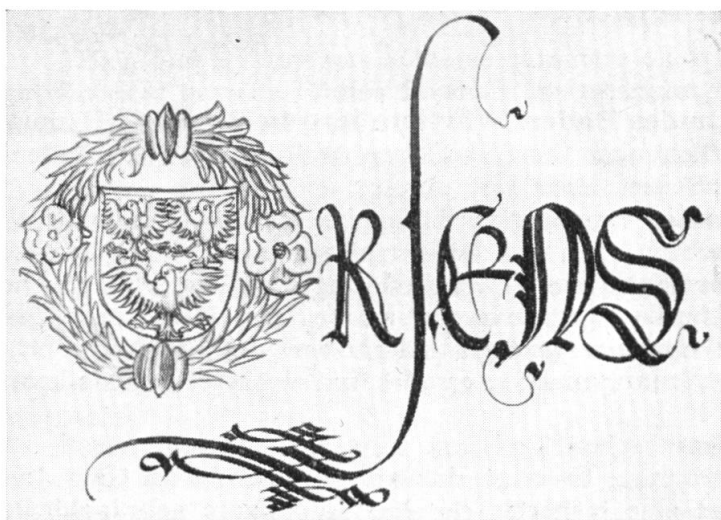
Fig. 14. Initiale aux armes de Pierre de Constantine.