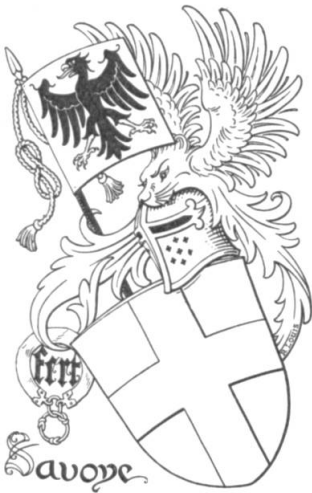
Fig. 11. Savoie.

Succédant aux Comtes particuliers de la première race issue de Foulques Nerra, les Comtes d'Anjou de la deuxième race surnommés « Plantagenet », en raison de leur symbole le genêt, devinrent par mariage rois d'Angleterre et portaient deux léopards dans leurs armes. Philippe-Auguste confisqua le Comté à Jean sans Terre et le donna à son frère Charles qui forma la troisième dynastie d'Anjou. Il prit comme armes l'écu de France avec la bordure de gueules comme brisure de cadet. Dans cette composition l'écu est supporté par les deux léopards (lionnés) des Plantagenet tenant la bannière d'Anjou ancien et celle à la croix d'Anjou qui figurent dans les scènes de la tapisserie de l'Apocalypse, au musée du Château d'Angers. En pointe dans les pampres du vignoble d'Anjou, le troisième léopard avec la date 1154 rappelle celui qu'Eléonore d'Aquitaine apporta par son mariage à Henri Plantagenet Comte d'Anjou après qu'elle eut été répudiée par le roi Louis VII (fig. 12).