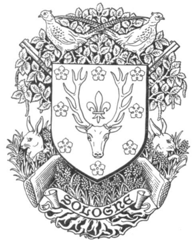
Fig. 13. Sologne

Sologne. — Blason: D'azur au rencontre de cerf d'or surmonté d'une fleur de lis du même, accompagné de huit quintefeuilles d'argent mises en orle. L'écu est sommé de deux faisans adossés d'or, leurs queues croisées en sautoir. Il est posé sur deux fusils de chasse d'or aussi en sautoir brochant sur un bouleau arraché d'argent fruité d'or, les racines chargées d'un listel de parchemin orné du mot « Sologne » en lettres onciales de sable. Le listel soutient un tertre diapré de brindilles et de bruyères d'argent fleuries de pourpre, duquel sont issants de leur terrier, à dextre et à senestre deux têtes, cols et pattes de lapins de garenne d'or.