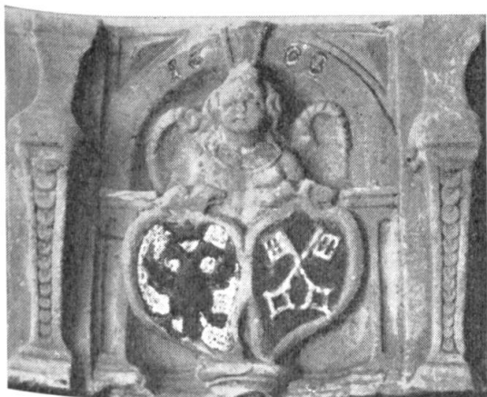
Abb. 14. Zweiteiliges Mindener Wappen (Stadt und Bischof) 1608.

Der Magistrat der Stadt Minden bemühte sich, die Anerkennung seiner Freiheiten auf dem Westfälischen Friedenskongress im Jahre 1648 durchzusetzen. In einer seiner Eingaben heisst es, dass der doppelköpfige Adler im Mindener Stadtwappen von Karl dem Grossen, die zwei gekreuzten Schlüssel von dem Sachsenherzog Widukind verliehen seien. (Spannagel, Minden-Ravensberg unter brandenburgisch-preussischer Herrschaft von 1648 bis 1719 . Hannover u. Leipzig 1894. S. 21). Diese historisch unsinnigen Behauptungen wurden bereits 19 Jahre nach Erteilung des Schutzprivilegs Kaiser Ferdinand II. aufgestellt. Wenn der Adler im Mindener Stadtwappen nicht länger als 19 Jahre im Gebrauch gewesen wäre, hätte man sich wahrscheinlich noch aus eigener Erinnerung heraus dieses Schutzprivilegs entsonnen und nicht diese sicherlich auch schon damals nicht ernst genommenen Begründungen vorgebracht. Anzunehmen ist daher, dass der Adler bereits vor 1627 bekannt und in Gebrauch gewesen ist. Der Vorgang aus dem Jahre 1627 dürfte eher die offizielle Legalisierung für das Führen beider Wappenbilder darstellen.