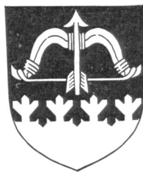
Fig. 3. Armoiries communales de Joutsa.

Un nouveau trait de partition. — Les manuels d'héraldique contiennent un grand nombre de traits de partition — on pourrait dire un trop grand nombre — et il semble assez inutile d'en inventer de nouveaux. Faisons cependant une exception pour un trait de partition inventé par notre membre Gustaf von Numers, Helsinki, Finlande. Ce trait qui représente des branches de sapin stylisées symbolise dans les blasons finnois les grandes forêts dont le pays est si riche. Quatre communes finnoises ont déjà adopté — avec l'autorisation du gouvernement — des armoiries aux traits de sapin. La dernière est Joutsa, qui porte de gueules à la champagne d'argent formée d'un trait de sapin, surmontée d'un arc