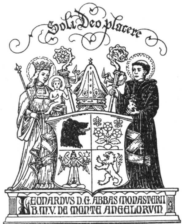
Abb. 12. Exlibris des Abtes Leonhard Bösch von Engelberg.

Une matrice de sceau de l'Hospice du Grand-Saint-Bernard. — Le Musée national suisse a reçu dernièrement à l'examen une matrice de sceau provenant de l'Hospice du Grand-Saint-Bernard, communiquée par le Museum für Hamburgische Geschichte. Cette matrice en bronze se compose d'une plaque ronde profondément gravée, de 50 mm de diamètre et de 5 mm d'épaisseur, à laquelle est soudée une poignée semi-circulaire haute de 29,7 mm et large de 4,3 mm. Elle pèse 148 g.