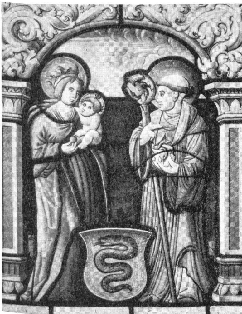
Fig. 15. Wappen des Klosters Hermetschwil.

Eine Figurenscheibe mit dem Wappen des Frauenklosters Hermetschwil. — Die Abtkapelle des Stiftes Engelberg schmückt eine Scheibe des Klosters Hermetschwil (fig. 15), welche der kürzlich verstorbene Abt Leodegar Hunkeler dank einem gütigen Entgegenkommen