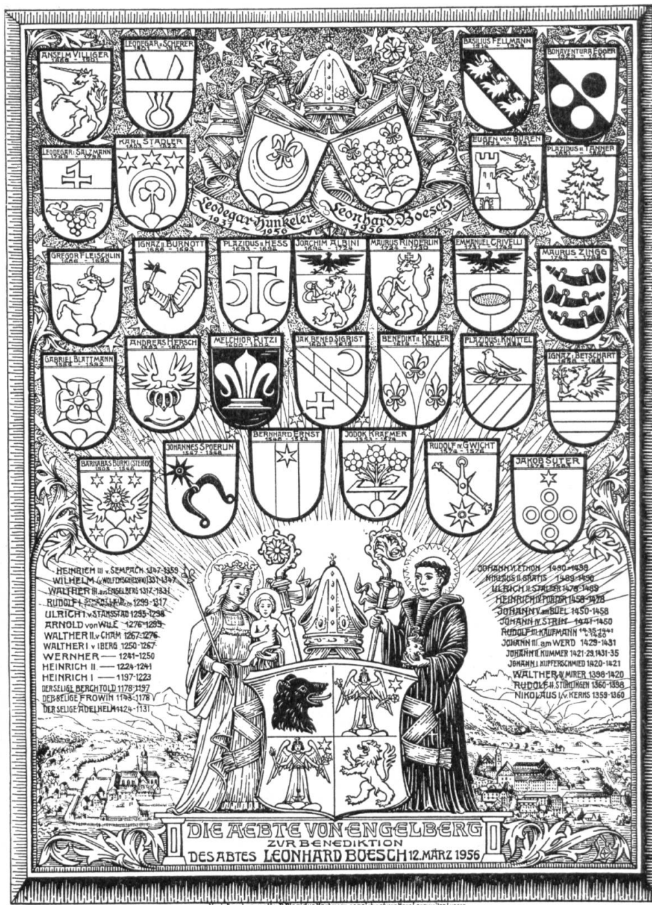
Abb. 13. Wappenblatt der Aebte von Engelberg.

La légende, qui fait le tour complet du sceau, est en gothiques minuscules : « S: in: dul: gentiarū: stor: / bernardietnicolayd'mōtiiovis*** » [Sigillum indulgentiarum sanctorum Bernardi et Nicolay de Montis Jovis].