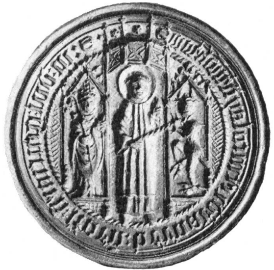
Fig. 14. Matrice de sceau du Grand-Saint-Bernard réservé aux indulgences, vers 1490.

[La matrice elle-même est inédite, seul un dessin médiocre en reproduit les traits principaux dans le Lexikon für Theologie und Kirche , Freiburg i. B. 1931, tome II, col. 206.]