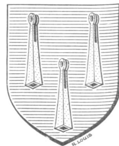
Fig. 36. Armes Collet, de Montbozon.

Une pièce héraldique rare. — La famille COLLET, de vieille bourgeoisie franc-comtoise originaire de Montbozon , en Haute-Saône, porte les armes suivantes, dont on ne connaît pas l'origine: d'azur, à trois collets d'éperon d'or, posés deux et un (fig. 36, dessin de M. R. Louis, à Paris); devise: « Hardi Montbozon! ».