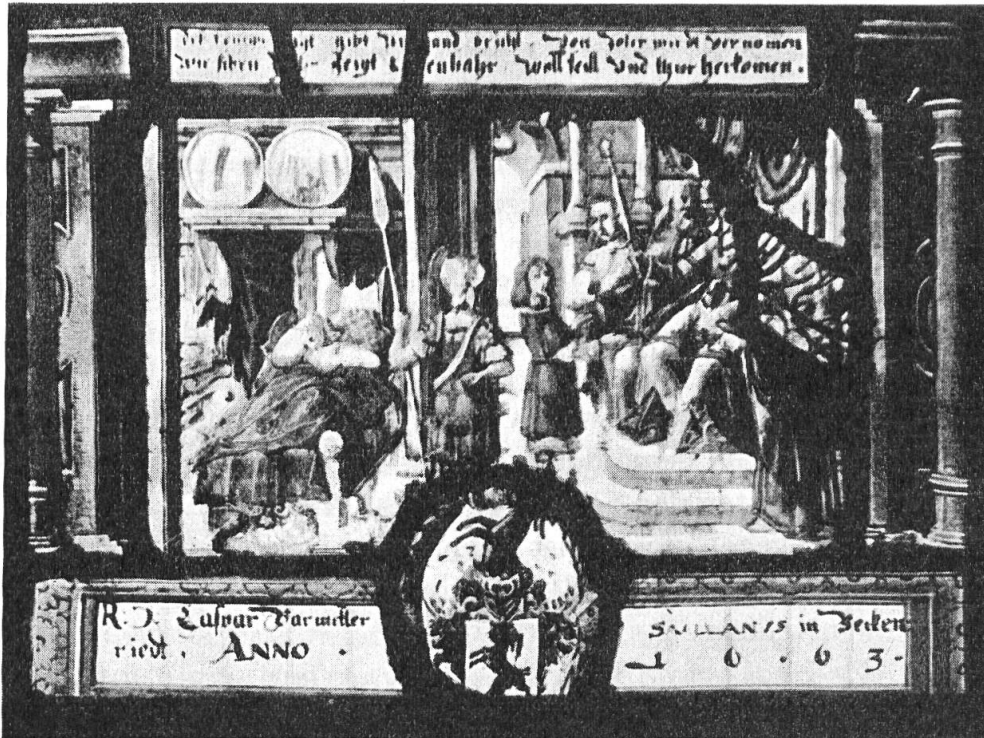
Fig. 115. Scheibe des Caspar Barmettler, Kaplan in Beckenried, 1663.

Deren treizeehen Ord't Schild in der Eidtgnoßschaft Gott ver liehe inne fryd weyshaid vnd Kraft. 1636