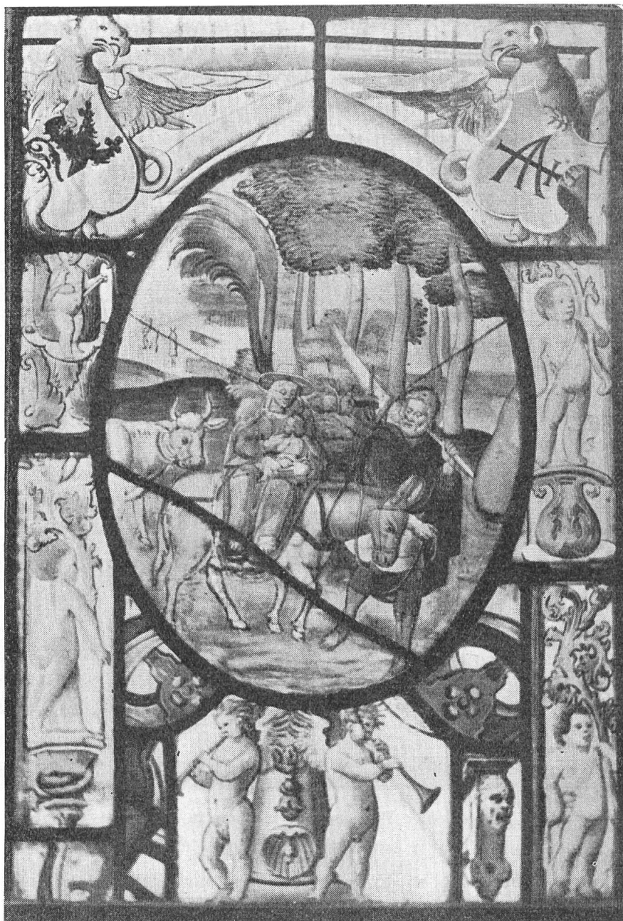
Fig. 119. Scheibe aus Stücken deutscher Herkunft, mit unbekanntem Wappen.

Stifters, der im Vordergrund im Gespräch mit einem Geistlichen dargestellt ist. Es ist, wie die Inschrift besagt, auch einer vom Geschlecht der Barmettler :