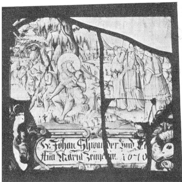
Fig. 66. Scheibe des J. Schwander, 1670.

Links das Steinegger-Wappen : in bl. ein w. Ziegenbock mit g. Hörnern ; Helmzier : wachsender w. Bock mit g. Hörnern. Rechts das Hegner-Wappen : in bl. ein g. Löwe mit einem schw. Hauszeichen in den Tatzen ; Helmzier : wachsender g.-bl. gespaltener, gekleideter Jünglingsrumpf mit dem schw. Hauszeichen belegt. Das Bild zwischen den Rahmensäulen stellt die Anbetung der Hirten dar ; in dem Wolkenkranz ein Engel mit Schriftrolle « Gloria in Excelsis » (Fig. 65).