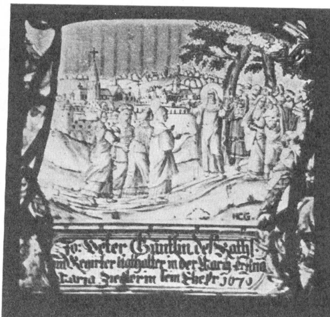
Fig. 64. Scheibe des J. P. Guntlin, 1670.

Die folgenden vier Stücke, alles Grisaille-Arbeiten des Wiler Glasmalers Hans-Caspar Gallati 2) aus dem Jahr 1670 gehören wohl einer gemeinsamen Stiftung von Ehepaaren aus dem schwyzerischen Bezirk March an. In den Dimensionen und in der Komposition scheinen allerdings nur je zwei einander gleich zu sein. Aber bei genauerer Betrachtung sieht man, dass die beiden schmälern Stücke (Nrn. 15 und 17) auf beiden Seiten beschnitten sind, sodass die das Bild einrahmende Säulenarchitektur weggefallen ist und die von einem ovalen Blattkranz umgebenen, die Stifterinschrift flankierenden Wappen nur verstümmelt zu sehen und darum auch von N. E. Toke nicht beschrieben sind.