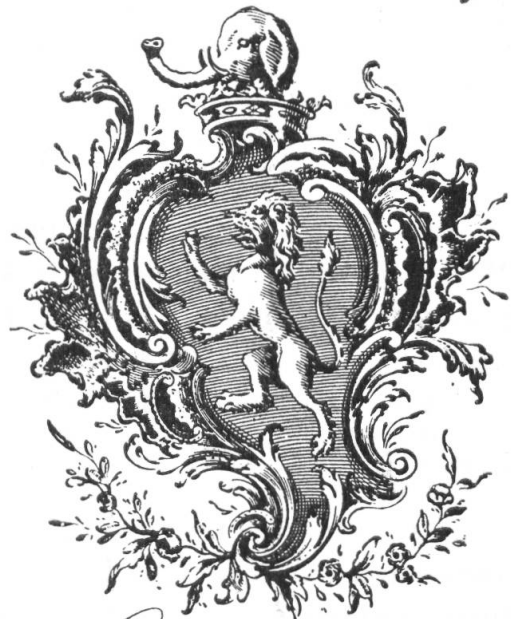
Fig. 56. Ex-libris d'A. de Villettes.