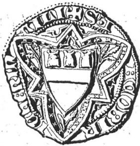
Fig. 111. (3/2)