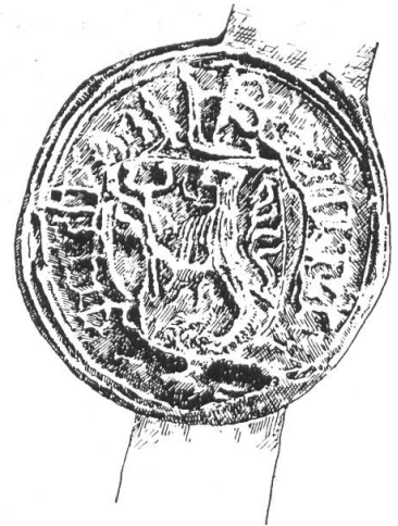
Fig. 97. Siegel des Ludwig Gsell, 1477.