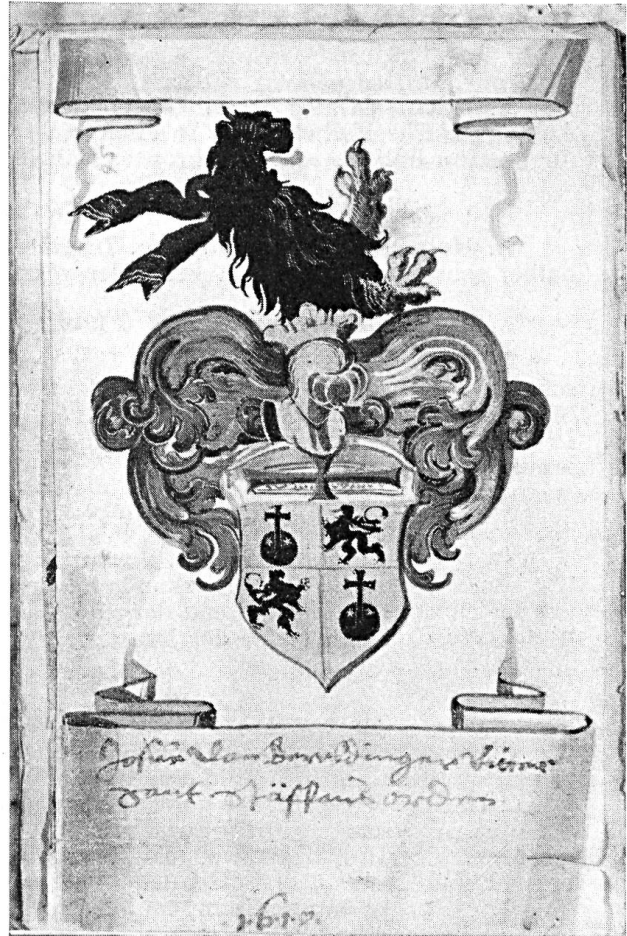
Fig. 121. von Beroldingen.