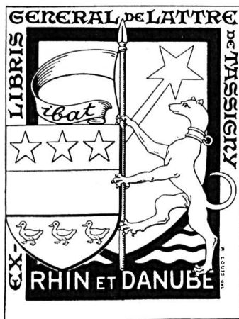
Fig. 72. Ex-libris du Maréchal de Lattre de Tassigny.