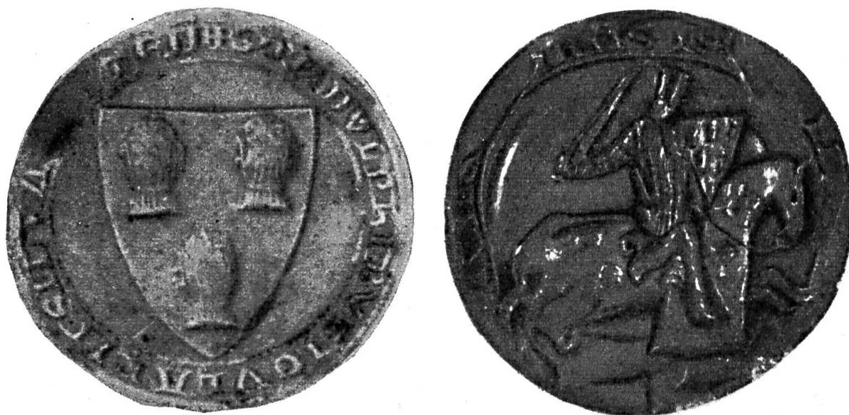
Fig. 32 et 33. Sceaux de Raoul le Bouteillier, sire d'Ermenonville, comme écuyer en 1266. ————— comme chevalier en 1284.

testée, ont été plus lentes à suivre les nouveaux errements et c'est chez elles, plus traditionalistes, que persista longtemps la règle ancienne qui refusait au non-chevalier l'usage du scel. Dans la maison de Méru, cadette des comtes de Beaumont-sur-Oise, Jean de Beaumont, écuyer, fils de Barthélemy, chevalier, sire de Meru, plaçait encore, en 1288, le lion des Beaumont sur un simple signet sans écu (DD 2635). Gui, Bouteillier de Senlis, écuyer, prenait en 1281 un signet à l'étoile (DD 1529) et, chevalier en 1297, un sceau équestre (DD 1522). Jean, fils d'Anseau III de l'Isle Adam, use encore, comme écuyer, d'un signet à l'étoile (Leblond, p. 824) ; chevalier en 1260, d'un écu armorié (DD 2457) ; son cousin germain Ansel, fils de Pierre chevalier, écuyer en 1273, porte un paon sur son signet (DD 2450) ; sa femme,