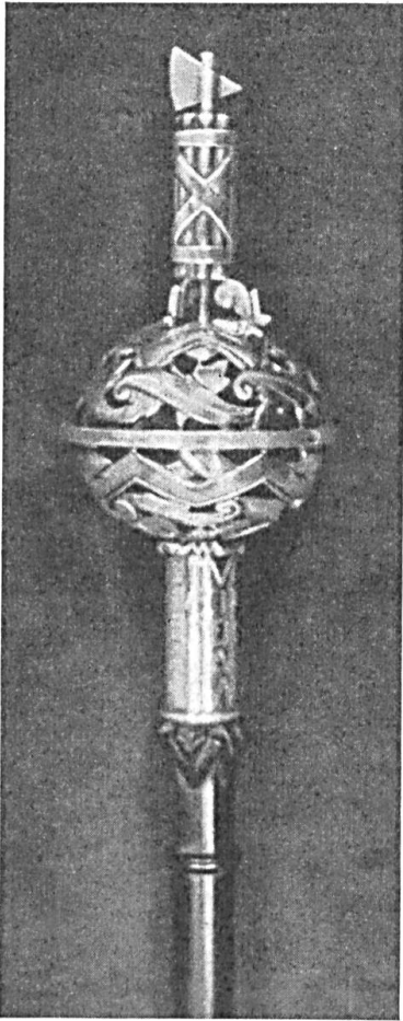
Fig. 55. Das Szepter des Kantons St. Gallen.

irgend einer Stilrichtung innerhalb der Blasonierung wahr. Unser Vorschlag, der dann auch im Gemeindewappenbuch festgelegt wurde, lautet :