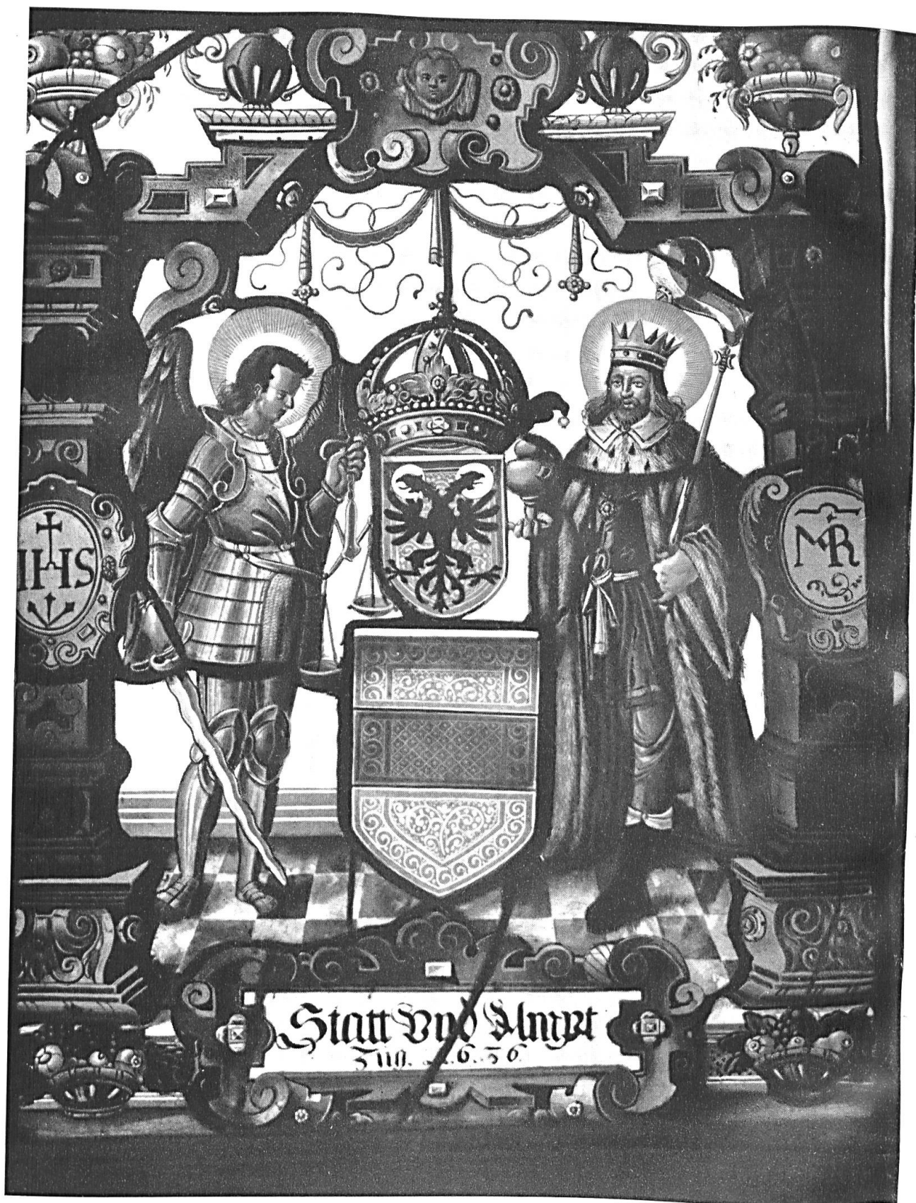
Stadt und Amt Zug, 1636. Scheibe aus der Kapelle zu Haltikon.