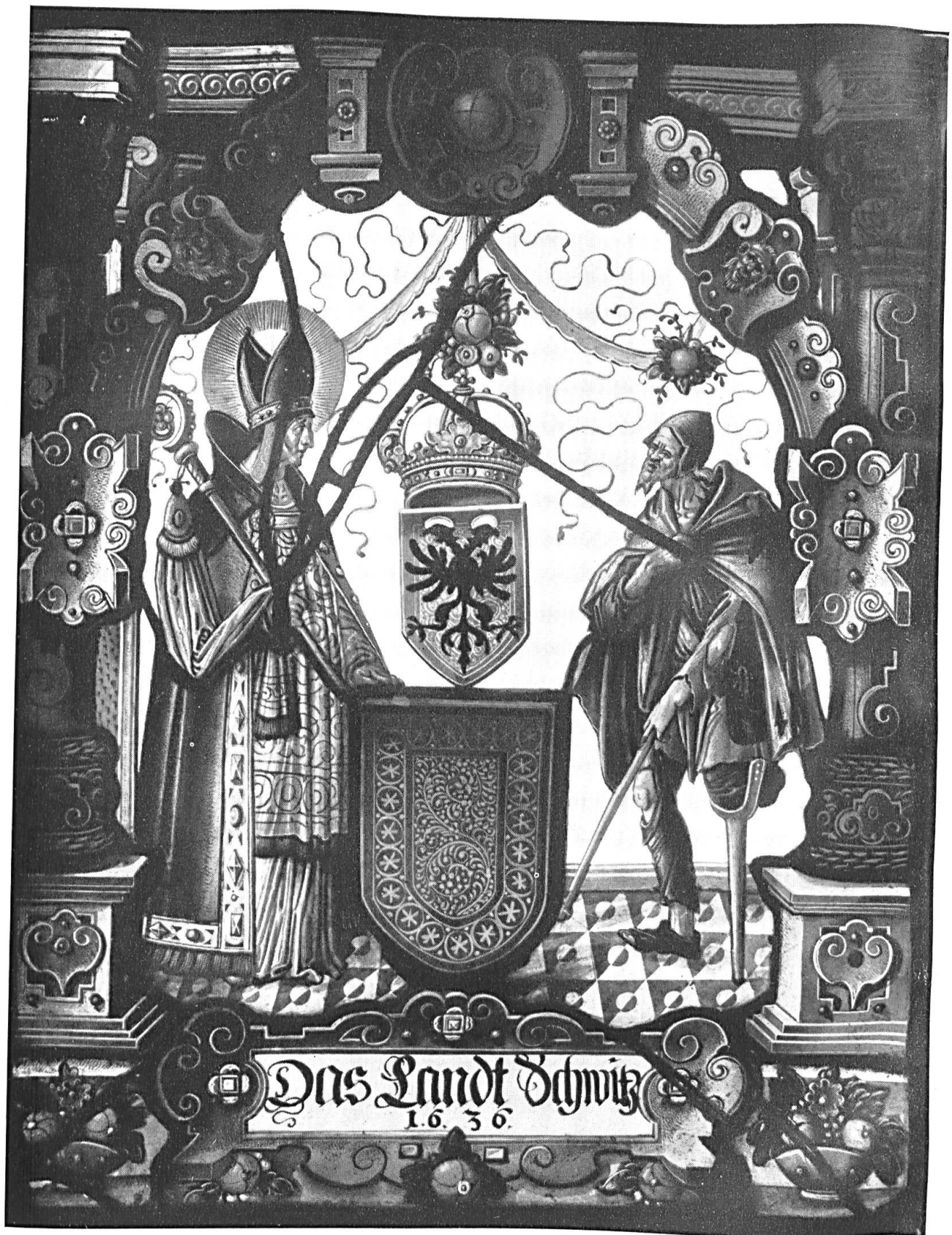
Das Land Schwyz, 1636. Scheibe aus der Kapelle zu Haltikon.