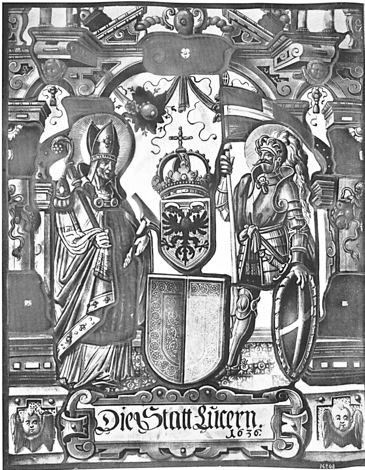
Die Stadt Luzern, 1636. Scheibe aus der Kapelle zu Haltikon.