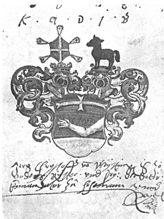
Fig. 54. Jerg Christoff von Weytingen, St. Joh. O. Ritter.

Der Liber Amicorum des Ratsherrn Leonhard Respinger dürfte das inhaltreichste noch erhaltene Stammbuch Basels aus der Zeit unmittelbar vor Ausbruch des Dreissigjährigen Krieges sein. Von den hundertzweiundzwanzig Eintragungen sind nur sechs ohne Beigabe eines Familienwappens, die übrigen hundertsechzehn Blätter weisen schön ausgeführte Wappen auf, welche meist mit lateinischen, fran-