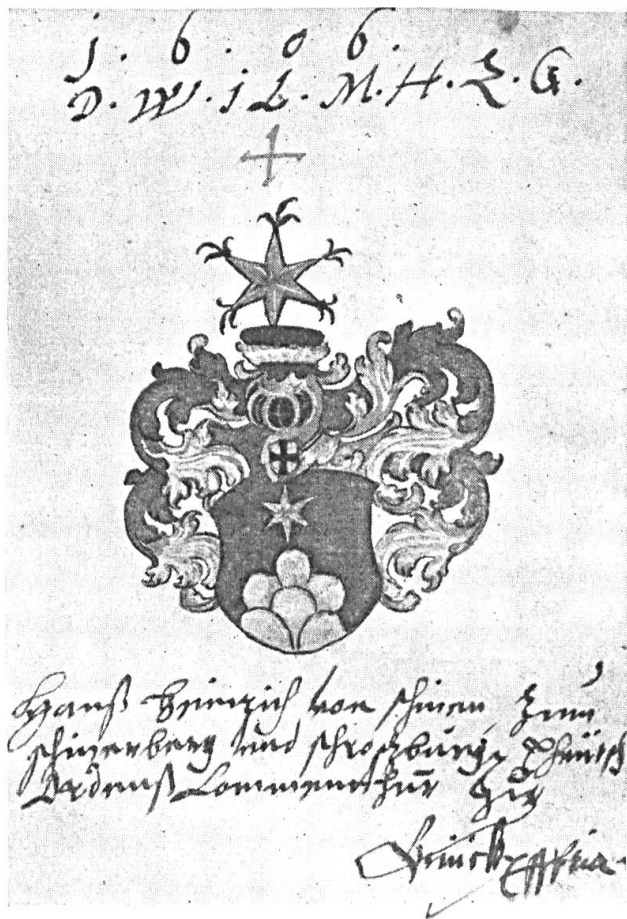
Fig. 56. Hanss Heinrich von Schiner zum Schinerberg und Schrozburg, Theutsch O. Comm.

Lass Dir bei Zeit unrecht thun, So kommst Du desto balder darum. Basel den 29 Novembris Ao. 1620.