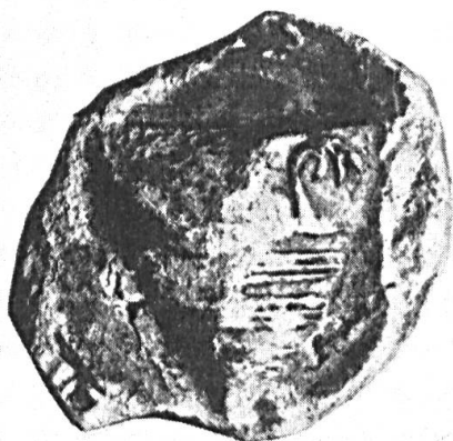
Fig. 47. Arnoud van Beke, 1266. S'AR.....