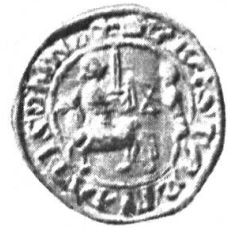
Fig. 52. Bastard, schepen van Hulst, 1276. + SIG BASTARTI .ATIS S..NE.

D'autre part, le développement des armoiries nobiliaires a été plus rapide. Quand l'héraldique bourgeoise eut adopté l'écu pour y placer ses emblèmes, un arrêt se produisit dans son développement. Les bourgeois prenant part à la guerre faisaient usage d'écus, aussi le droit de porter l'écu ne leur était-il nullement contesté. Il n'en était pas de même en ce qui touche le casque et le cimier ; c'est pour cette raison que ces objets ne furent utilisés que beaucoup plus tard, par esprit d'imitation et dans un but décoratif. Ce n'est qu'avec beaucoup d'hésitation que cet usage nobiliaire fut adopté par la bourgeoisie. De même, l'emploi d'accessoires décoratifs dans l'héraldique bourgeoise des Provinces Septentrionales, fut toujours relativement restreint.