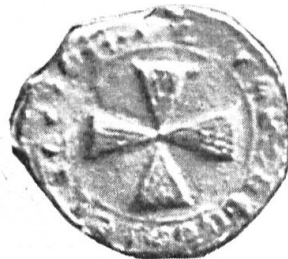
Fig. 51. Gherard Yensoene, 1297. Légende illisible.