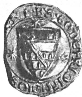
Fig. 45. ✓ Godfried Osenzoon, 1256. + S.GODEFRIDI FILII OS(e scabi)NI.

C'est dans le territoire actuel des Pays-Bas que la bourgeoisie parvint d'abord à s'élever jusqu'aux plus hautes charges et qu'elle obtint les plus grands honneurs ; c'est donc naturellement dans ce pays que l'on doit trouver les plus anciennes armoiries bourgeoises. Dès 1248 Nicolaas van Putten, bourgeois de Middelbourg, faisait usage d'un sceau 1) , sans écu, portant une aigle (fig. 43). En 1253 Godfried Hundertmark, échevin de Maestricht, employait déjà un sceau sur lequel figure un écu portant 6 oiseaux, 3, 2 et 1 (fig. 44).