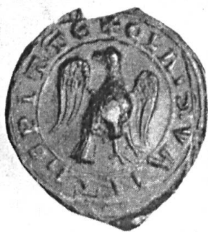
Fig. 43. ✓ Nicolaas van Putten, 1248. + CLAIS.VAN THE PITTE.

Si nous comparons l'héraldique néerlandaise à l'héraldique helvétique, nous constatons qu'elles présentent certaines ressemblances. Ces deux pays se sont constitués en républiques autonomes à l'aube des temps modernes ; à cette époque la bourgeoisie y constituait déjà la classe dominante, alors que dans tous les autres pays la monarchie absolue continuait à tenir le sceptre. A la faveur de telles circonstances, l'héraldique néerlandaise prit, comme en Suisse, un caractère bourgeois. J'entends par là que, dans ces deux pays, plus que partout ailleurs, les bourgeois et les paysans possédaient des armoiries, ce droit n'étant limité par aucune ordonnance royale.