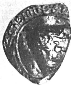
Fig. 44. ✓ Godfried Hundertmarc, 1253. + S'G (odefridi hundertma)RC SCABINI.