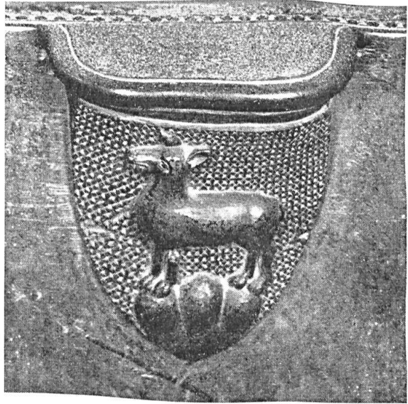
Fig. 13 und 14. Miserikordien mit den Wappen Schaler und Thierstein, ✓

und Kirchherr zu Gebwiler, 1368 Erzpriester und 1382 avignonesischer Gegenbischof als Kandidat Herzog Leopolds von Oesterreich (Fig. 13).