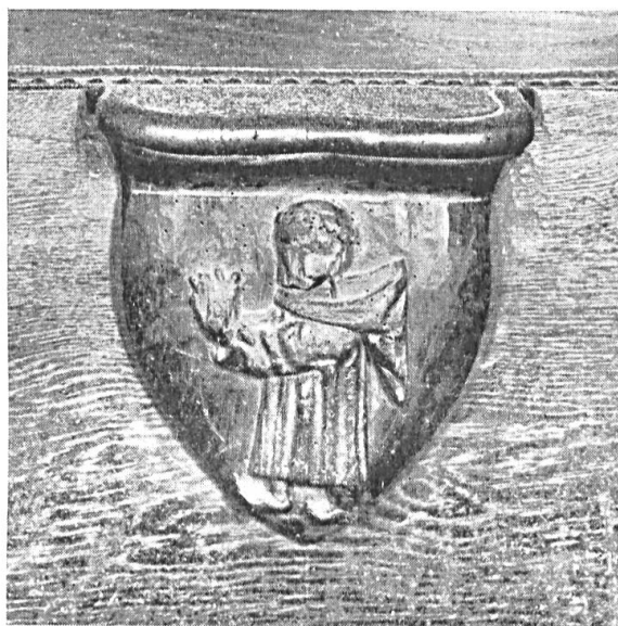
Fig. 11 und 12. Miserikordien mit den Wappen Hohenklingen und Münch.