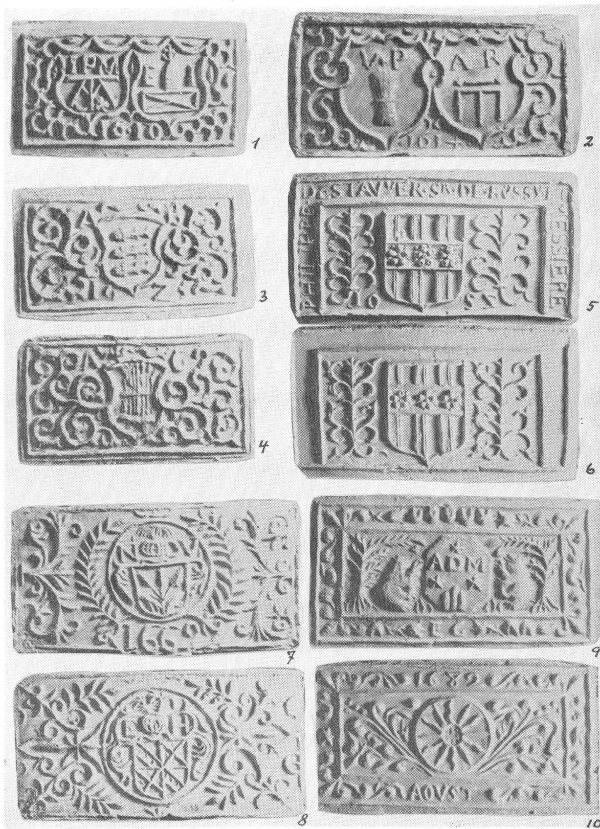
Fers à gaufres armoriés vaudois, II