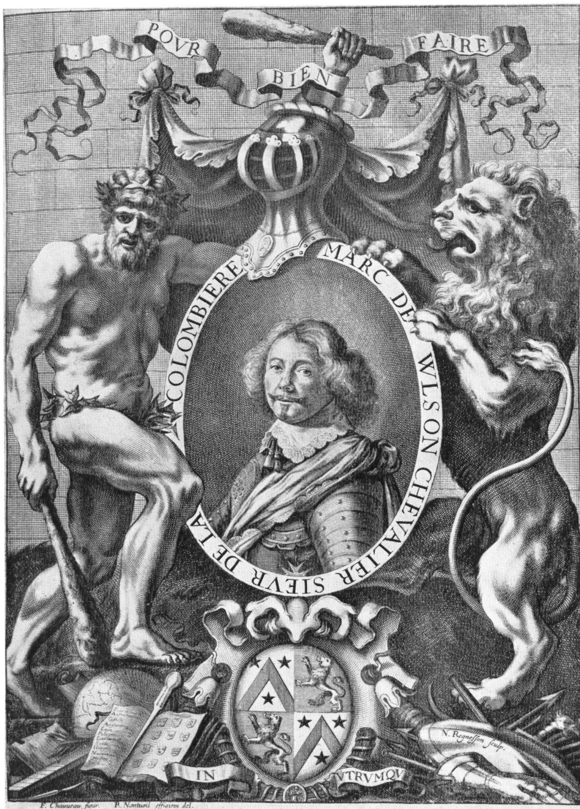
Portrait de Marc de Vulson de la Colombière.