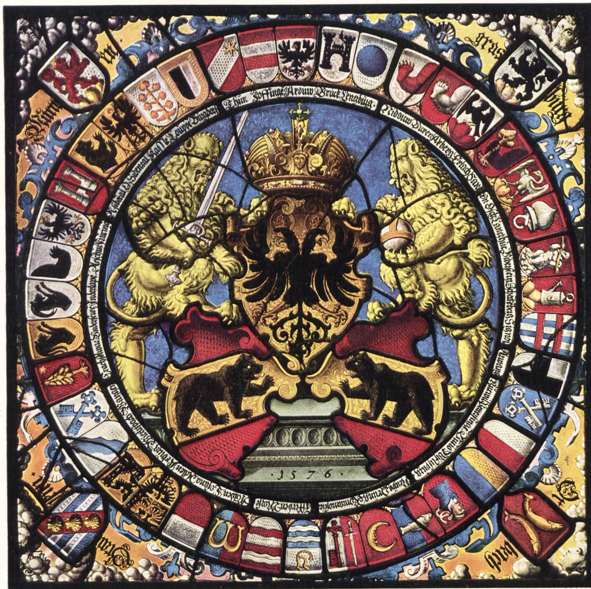
Berner Standesscheibe von Abraham Bickhart. 1576