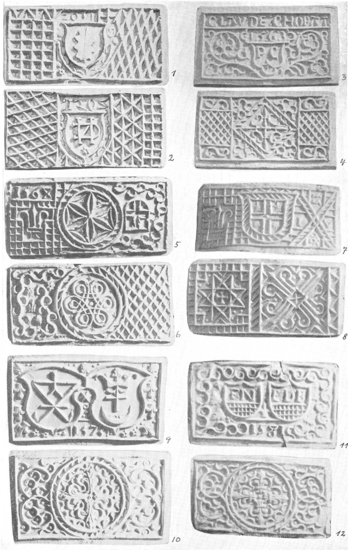
Fers à gaufres armoriés vaudois, I