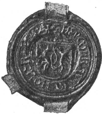
Fig. 78. Konrad v. Hohenrechberg, 1513/26.

gestellten beiden Schilde (Taf. VII, 7). Auf einem Spruchbande ist zu lesen : S. coradi d'hothenrechberg abbat. loci hēmita. Infolge von Zerwürfnissen mit den Schwyzern zog sich auch dieser Abt 1490 für gut zehn Jahre nach St. Gerold zurück und