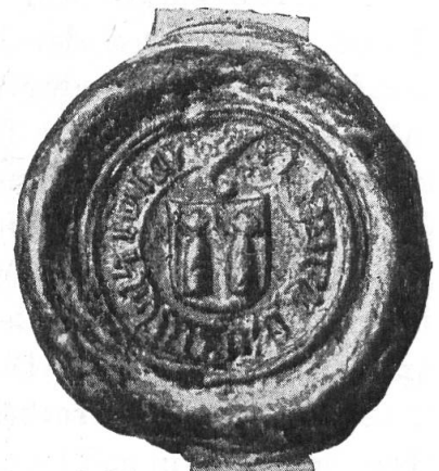
Fig. 79. Barnabas v. Mosax, 1490/1501.

Barnabas von Mosax war ein Verwandter der Aebte Rudolf und Gerold von Hohensax. Er gehörte einer jüngern Linie der Herren von Sax an, die illegitimer Abkunft, durch Kaiser Maximilian geadelt wurde. Er erscheint seit 1465 im Kloster und übernahm 1490 für Abt Konrad die Verwaltung, die er bis zu seinem 1501 erfolgten Tode innehatte. Sein Siegel als Pfleger, von 28 mm Durchmesser, zeigt im Felde das Wappen der Mosax : ein von Rot und gelb gespaltener Schild mit zwei Säcken in gewechselten Farben (Fig. 79). Umschrift : . . . . barnabas vo : sax.