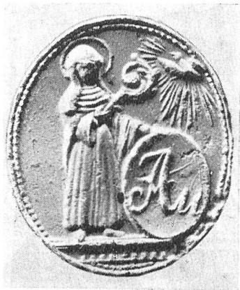
Fig. 107. Siegel des Klosters in der Au, bei Einsiedeln.

Seit dem 13. Jahrhundert lebten in der Nähe von Einsiedeln sogen. Waldschwestern. Im Jahre 1403 werden vier Häuser der Waldschwestern genannt, die an der Alpegg, in der vordern und hintern Au und an der Hagenrüti wohnten. Es waren dies Sammlungen oder Beghinenhäuser, denen Abt Hugo von Tierstein