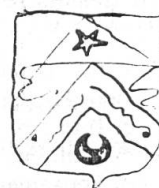
Fig. 96. Armes de François Roguin.