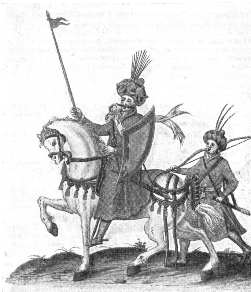
Fig. 99. Gratien Delavallée, 1623. Fo. 107. Liber Amicorum d'André Joffrey.