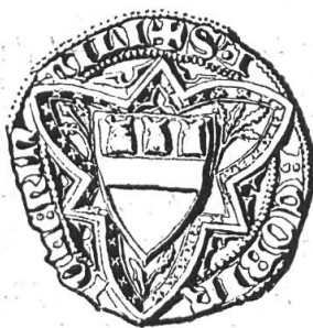
Fig. 111. (3/2)