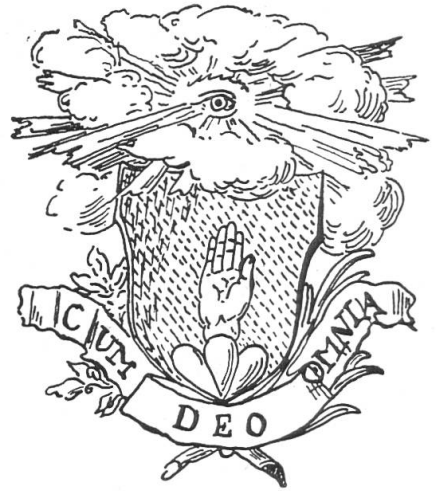
Fig. 110. Handtmann (n° 96).