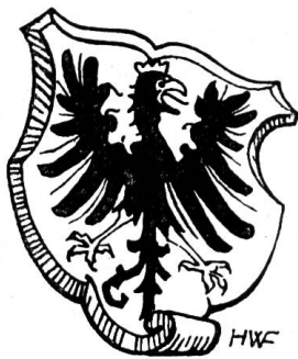
Fig. 9. Titelvignette eines Liedes « Zu Lob und Ehren denen von Frutigen ».

Entsprechend dem heutigen Brauche führen auf der Wappentafel im neuen Frutigbuch 1938 (Verlag Paul Haupt, Bern) Amt und Gemeinde dasselbe Wappen : In Silber ein schwarzer Adler mit goldener Krone und goldener Bewehrung (Fig. 8).