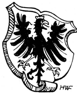
Fig. 9. Titelvignette eines Liedes « Zu Lob und Ehren denen von Frutigen ».

Entsprechend dem heutigen Brauche führen auf der Wappentafel im neuen Frutigbuch 1938 (Verlag Paul Haupt, Bern) Amt und Gemeinde dasselbe Wappen : In Silber ein schwarzer Adler mit goldener Krone und goldener Bewehrung (Fig. 8).