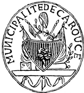
Fig. 6. Sceau de la Municipalité de Carouge, vers 1792.

Le champ des armes est souvent d'or, mais les plus anciens documents le donnent d'argent, ainsi celui que nous reproduisons, tiré d'un plan de la ville dressé en 1787 par J. M. Secretan (fig. 5). Les armes de Carouge sont donc : « d'argent au léopard au naturel, couché sur une terrasse de sinople et appuyé contre le fût d'un caroubier de même, fruité de gueules, planté sur la terrasse ». Supports : deux griffons affrontés. L'écu est sommé d'une couronne murale. Les couleurs communales sont rouge et vert.