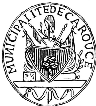
Fig. 6. Sceau de la Municipalité de Carouge, vers 1792.

Le champ des armes est souvent d'or, mais les plus anciens documents le donnent d'argent, ainsi celui que nous reproduisons, tiré d'un plan de la ville dressé en 1787 par J. M. Secretan (fig. 5). Les armes de Carouge sont donc : « d'argent au léopard au naturel, couché sur une terrasse de sinople et appuyé contre le fût d'un caroubier de même, fruité de gueules, planté sur la terrasse ». Supports : deux griffons affrontés. L'écu est sommé d'une couronne murale. Les couleurs communales sont rouge et vert.