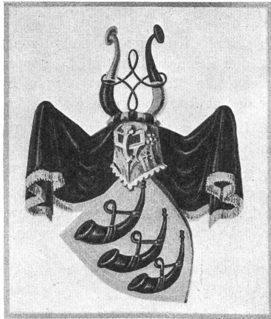
Fig. 65. Wappen aus der Copie der Adelsbestätigung Schlumpf 1727

Ein Zweig zog Ende des XIV. Jahrhunderts nach Nürnberg, wo Rupprecht Schlumpf am 13. Januar 1598 von Kaiser Rudolf II. eine Wappenbestätigung erhielt. Die Familie hat der Stadt St. Gallen eine ganze Reihe Bürgermeister, Zunftmeister und Stadtammänner gegeben.