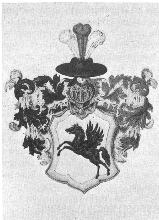
Fig. 66. Wappen aus der Copie des Adelsbriefes von Hochreut. 1729

Das Original war am 10. Dezember 1847 noch im Besitz von Präs. v. Gonzenbach in St. Gallen; heute ist sein Standort unbekannt.