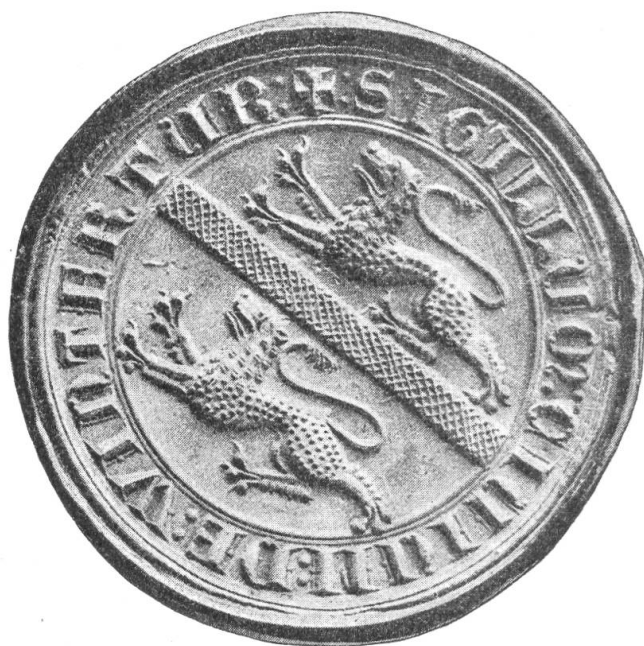
Fig. 106. Sceau de la Ville de Winterthour (fin du XIIIe siècle)

Deux mots d'abord de l'assemblée elle-même. Nos finances se ressentent de notre amputation momentanée des membres étrangers et d'un peu de largesse dans l'administration de nos biens. Mais nous remontons la pente: une plus grande prudence, un recrutement très satisfaisant, nous faisaient déjà espérer le retour, si ce n'est à la prospérité, du moins à l'aisance, quand l'Assemblée, allant au delà d'un timide vœu du Comité, décida résolument de porter la cotisation de l'an prochain à Fr. 15.—. Nous voici hors de soucis trop pressants et en mesure de réimprimer nos statuts et le catalogue de notre bibliothèque, instrument de travail indispensable aux plus zélés et aux plus actifs de nos membres.