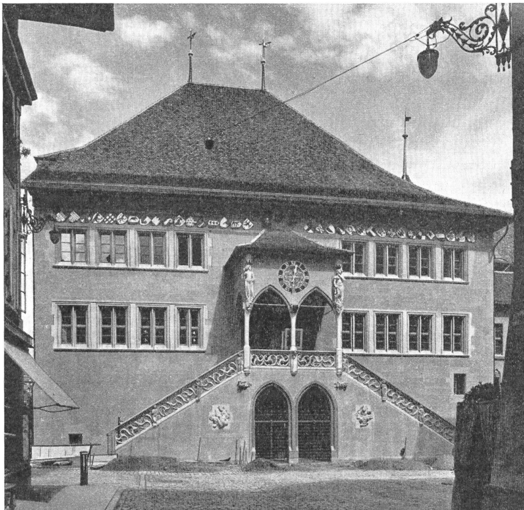
Fig. 55. Das Berner Rathaus nach der Renovation von 1940/42. Unter dem Dachgesims erkennt man deutlich den farbigen Wappenfries mit den Schildern der Amtsbezirke.

Im Herbst 1942 wurde der Umbau des Berner Rathauses, der mehr als zwei Jahre in Anspruch nahm, vollendet, und am 31. Oktober festlich eröffnet. Es lohnt