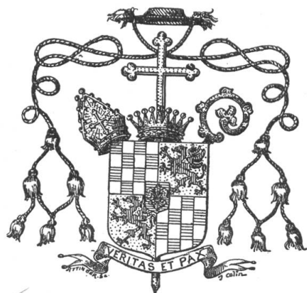
Fig. 87. Armoirie de Mgr Jules Maurice Abbet, coadjuteur dès 1895, évêque de Sion 1901—1918 ✓

Pour continuer dans nos Archives héraldiques l'étude des armoiries des évêques de Sion nous publions ici les armoiries de Mgr Bieler, successeur de Mgr Abbet. En application du nouveau droit ecclésiastique, le mode d'élection de l'évêque fut fixé par le St Siège par décision du 30 décembre 1918 et fut porté à la connaissance du Gouvernement valaisan. Le nouvel évêque fut désigné et nommé directement par le pape Benoît XV.