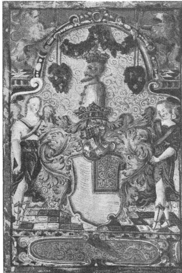
Fig. 74 Wappen aus dem Adelsbrief v. Zollikofer, 1594

Es handelt sich um Brüder und Vettern der schwarzen Zollikofer, die sich, seit Ulrich 1591 die Gerichtsherrschaft Nengensberg und Karrersholtz für sich erworben