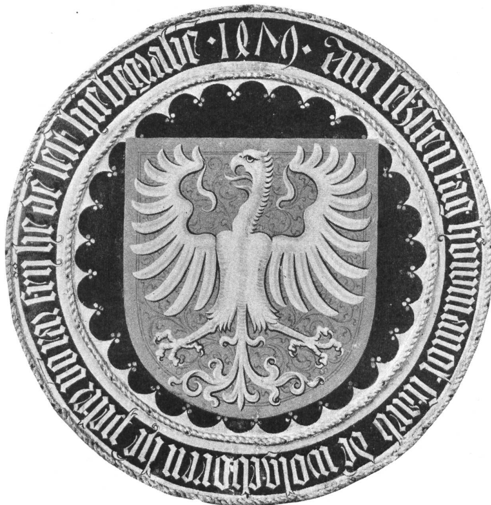
Fig. 16. Ecu mortuaire aux armes de Pierre de Rarogne.

fresque se trouvent deux écus d'or à l'aigle de sable , qui ne peut être que Rarogne. L'écu personnel de Guillaume, peint près de sa personne, est écartelé; au 1 Rarogne comme nous venons de l'énoncer; au 2 de gueules à l'aigle d'or , qui, d'après ce que nous savons de l'autre branche, ne peut être également que Rarogne; au 3 d'azur au château à deux tours d'or , qui est la seigneurie de Ville au Val d'Hérens, aussi dite Mont-la-Ville, possession très ancienne de la famille; enfin au 4 d'argent au basilic de sable, crêté de gueules , qui est l'écu des Urnavas de Naters, dont l'héritière Agnès était l'arrière-grand-mère de l'évêque.