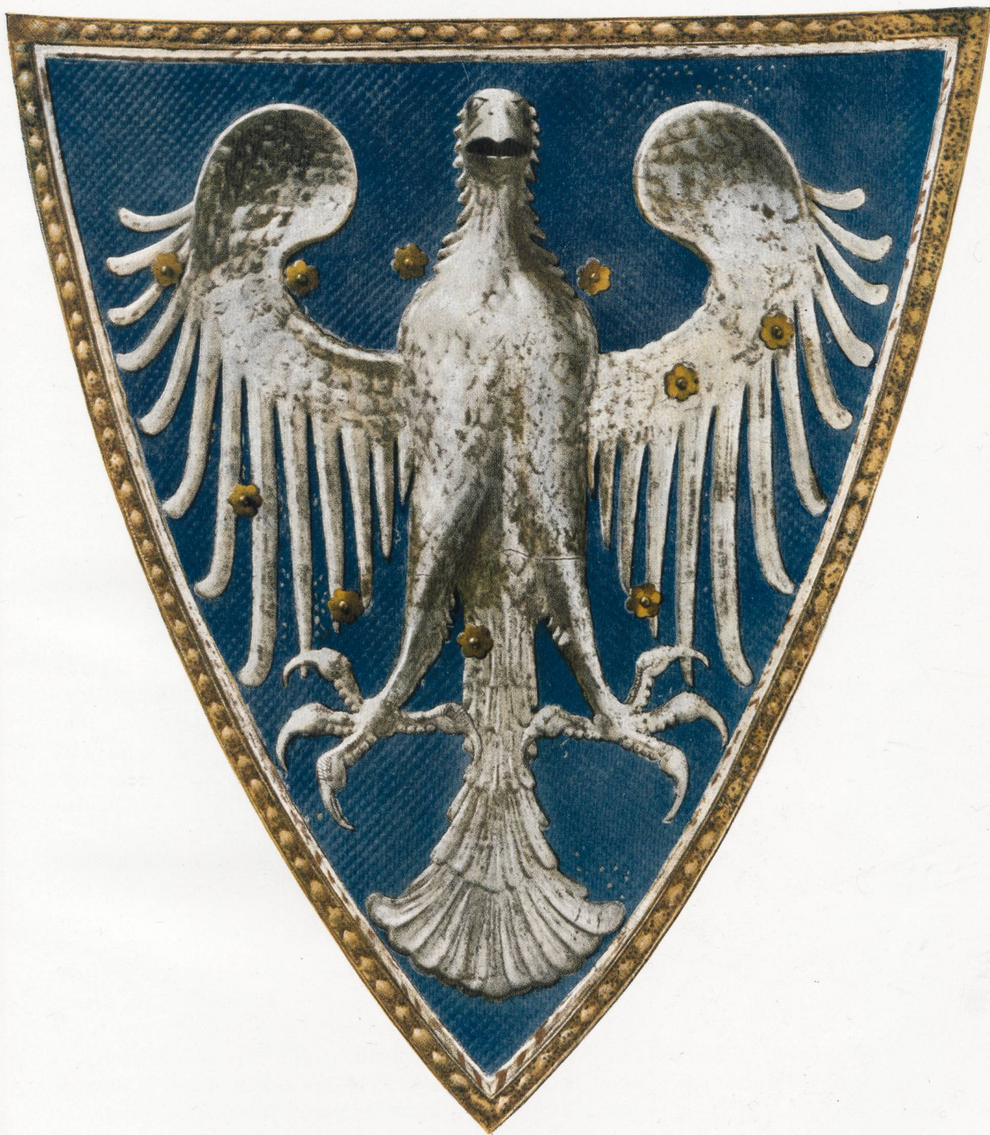
ÉCU DE RAROGNE (Musée de Valère à Sion)