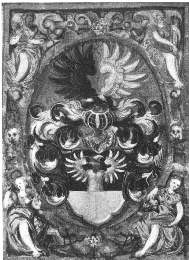
Fig. 13. Wappen aus dem Wappenbrief Studer v. Rebstein, 1585.

Studer von und zu Rebstein, 1585. Patrizisches Geschlecht zu St. Gallen, ursprünglich von Waldkirch, Bürgerrecht seit 1399. Die Familie teilte sich haupt-