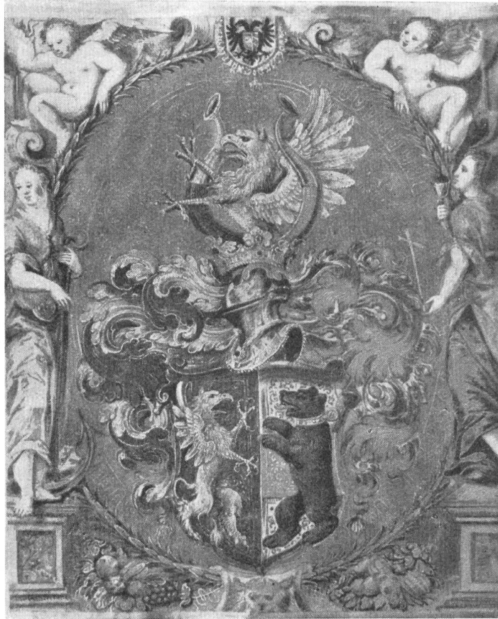
Fig. 14. Wappen aus dem Wappenbrief Rheiner, 1589.

Wappen: Gespalten von Blau mit goldenem linksgewendetem springendem, rotbezungtem Greif und von Silber mit rotem Querbalken, belegt mit schwarzem aufrechtem rechtsgewendetem Bären mit goldenem Halsband und Ring. Auf dem Stechhelm mit linken rot-weissen und rechten gelb-blauen Helmdecken eine Helmkrone. Helmzier: zwischen einem rechten gelb-blau und einem linken weiss-rot geteilten Büffelhorn ein wachsender goldener rotbezungter Greif.